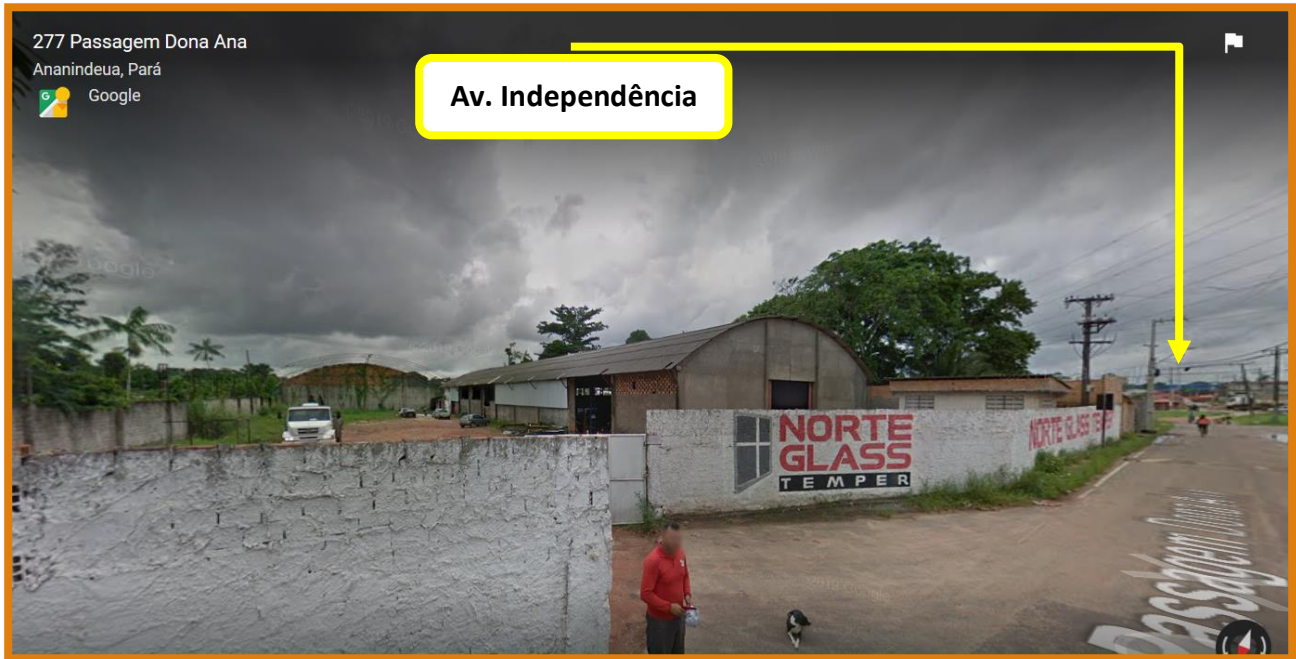
Passagem DONA ANA, 50, entre Av. Independência e Alameda Santa Helena, Ananindeua/PA, CEP 67.040-690