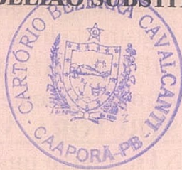
LUCIANO BEZERRA CAVALCANTE TABELIÃO SUBSTITUTO