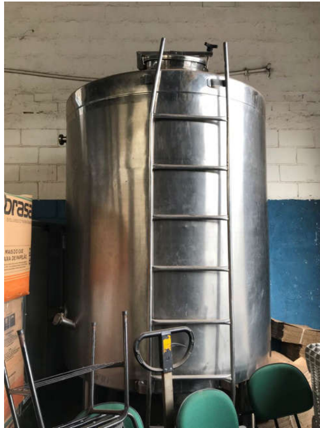
71 - TANQUE DE ESTOCAGEM COM CAPACIDADE DE 2000L