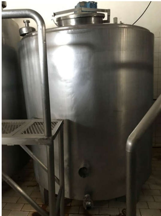
18 - IOGURTEIRAS PARA 3000L