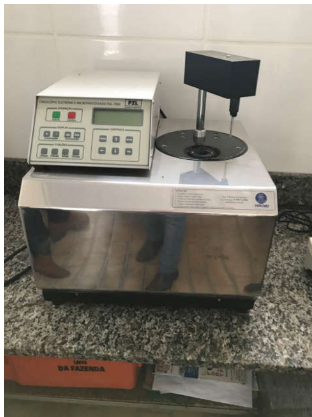
21 - CRIOSCÓPIO MICROPROCESSADO MARCA PZL