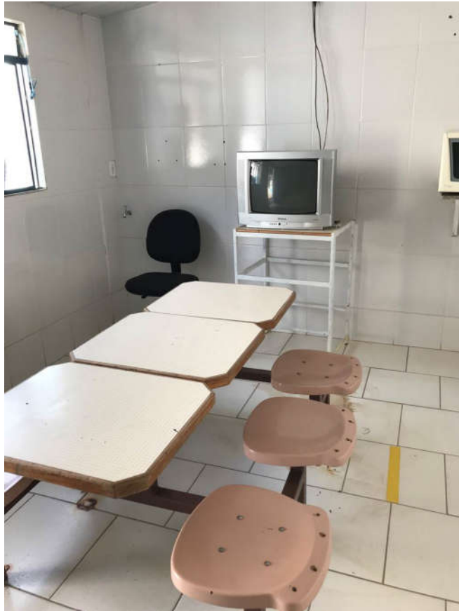
26 - MESA PARA REFEITÓRIO COM 06 CADEIRAS FIXAS