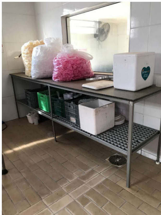
83 - QUANTIDADE INDEFINÍVEL DE PLÁSTICO TIPO PET EM DIVERSOS FORMATOS