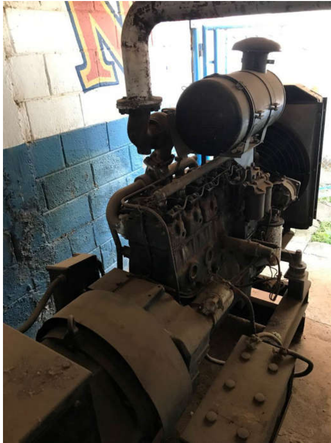
35 - GERADOR DE ENERGIA MARCA WEG