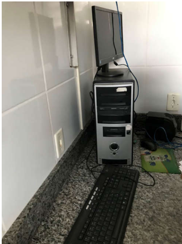
41 - MICROCOMPUTADOR COM MONITOR, TECLADO, ESTABILIZADOR E MOUSE