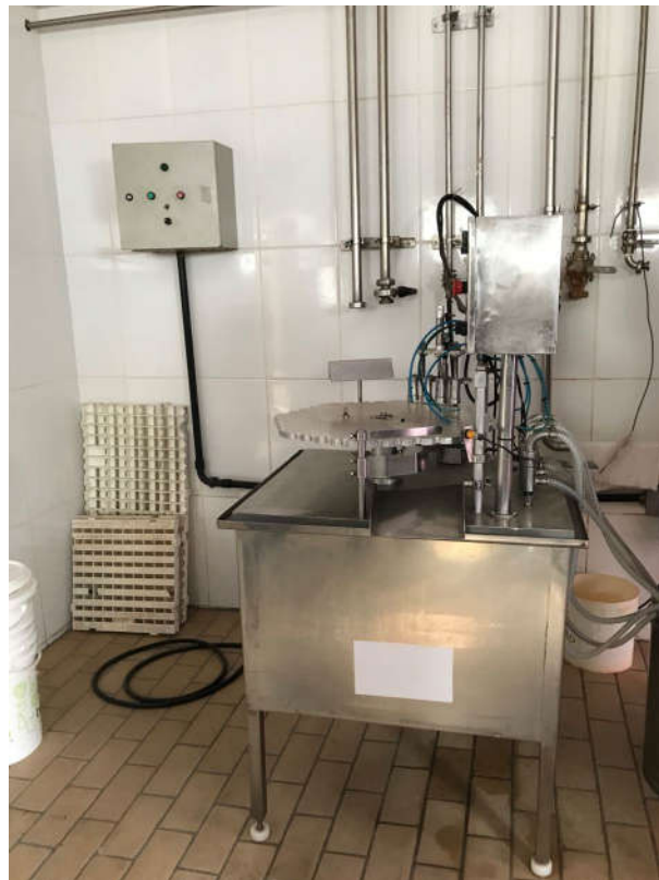
50 - MÁQUINA DOSADORA DE MAMUCHINHA