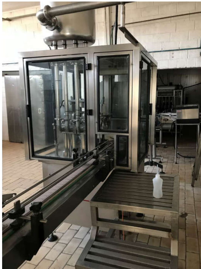
65 - MÁQUINA ENVASADORA PARA GARRAFAS MARCA PRIMO Y CIA. S/A