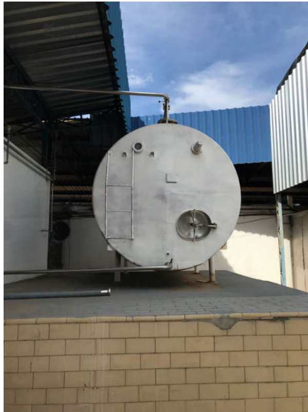
8 - TANQUE DE ESTOCAGEM DE LEITE EM INOX 10.000L