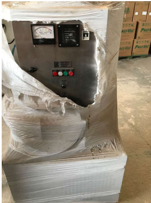
73 - MÁQUINA SELADORA AUTOMÁTICA MARCA GRC