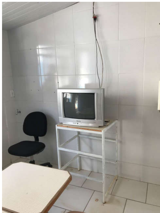
25 - TELEVISOR TUBO MARCA MITSUBISHI 20 POLEGADAS