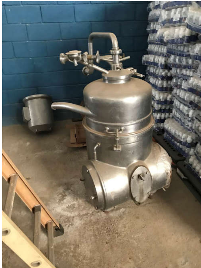
75 - MÁQUINA PADRONIZADORA EM INOX