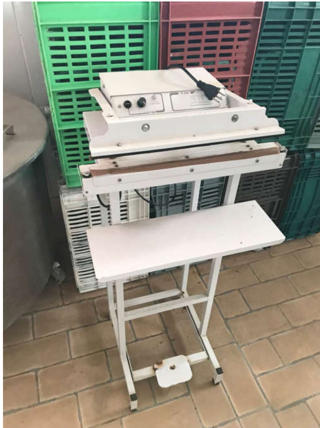
47 - SELADORA DE PLÁSTICOS MARCA BARBI