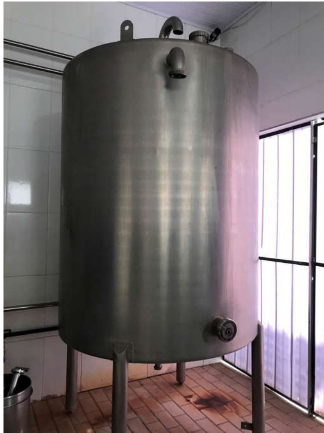
49 - TANQUE PULMÃO COM CAPACIDADE 2000L