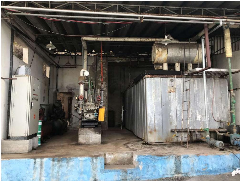
4 - CONJUNTO DE BANCO DE GELO