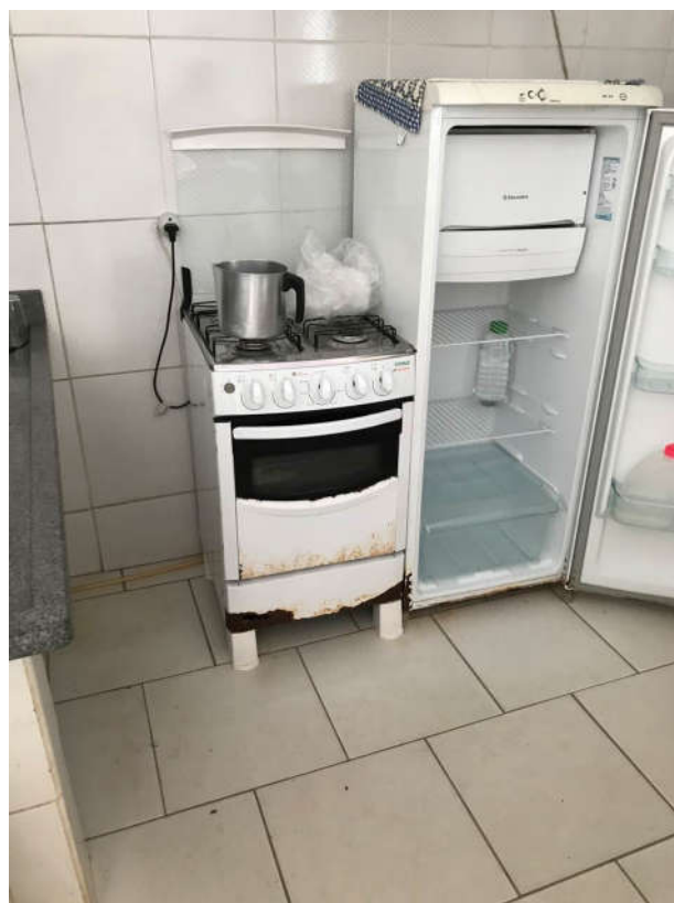
54 - FOGÃO 4 BOCAS MARCA CONSUL