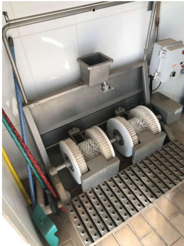
33 - HIGIENIZADOR DE BOTAS MARCA METALURGICA BALELA