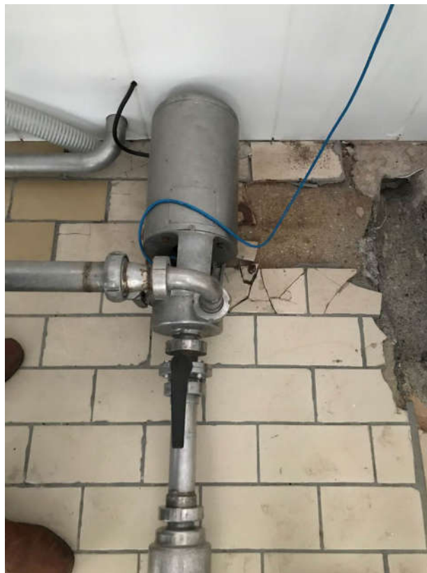
15 - BOMBA CENTRÍFUGA MARCA APV