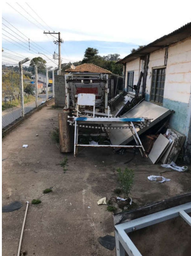
38 - LOTE DE SUCATA COM MATERIAIS PREDOMINANTEMENTE FERROSOS