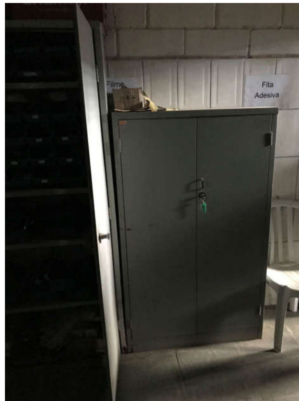
81 - ARMÁRIOS DE AÇO