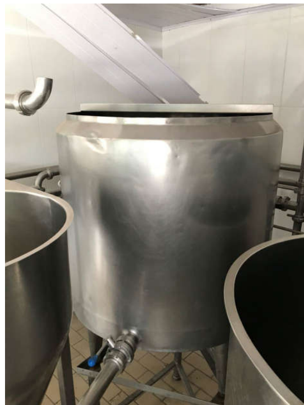
13 - TANQUE PULMÃO EM INOX, 500L CAMISA DUPLA