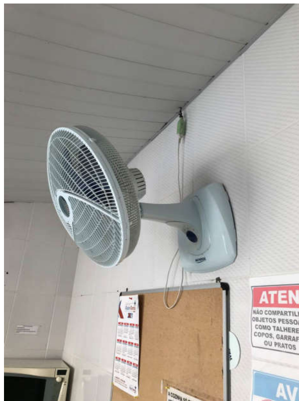
56 - VENTILADOR DE PAREDE MARCA MONDIAL