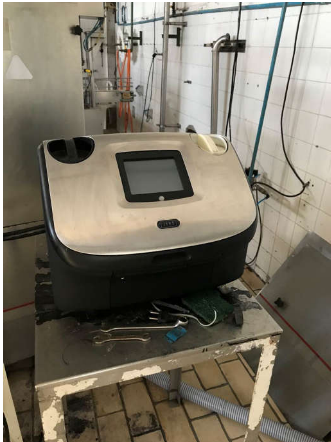
60 - IMPRESSORA MARCA INKJET, MOD. LINX.