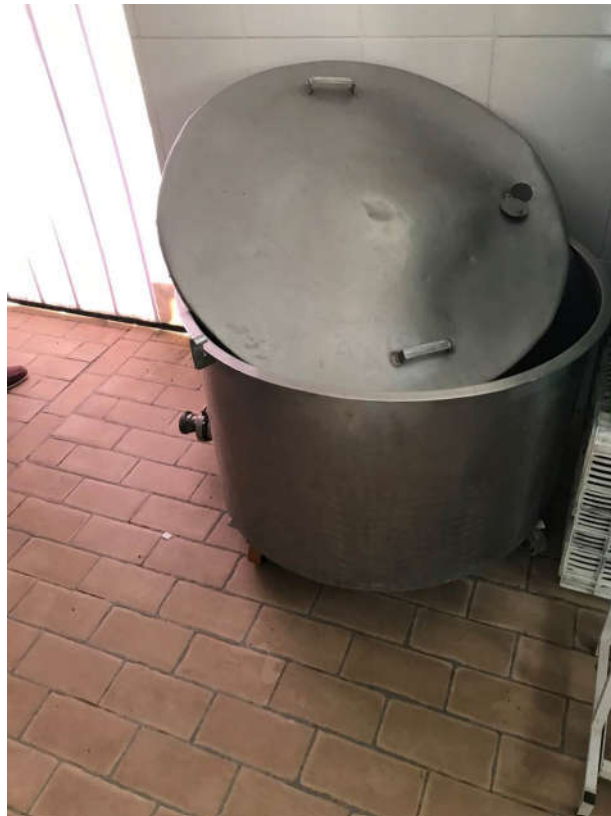
48 - TANQUE EM INOX COM CAPACIDADE APROX. DE 400L.