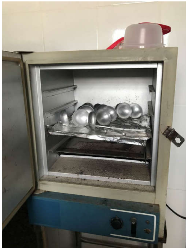
39 - ESTUFA MARCA CAP LAB