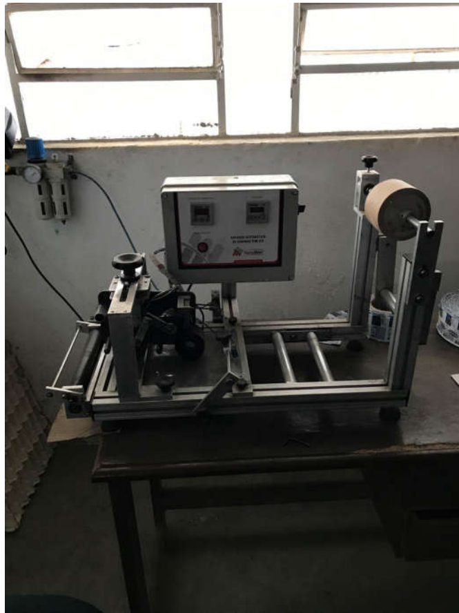
79 - DATADOR AUTOMÁTICO MARCA TECNO MARC, MOD. TM 07