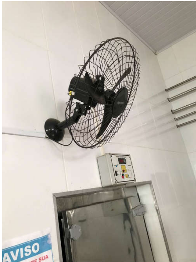
51 - VENTILADOR DE PAREDE MARCA VENTISUL NA COR PRETA