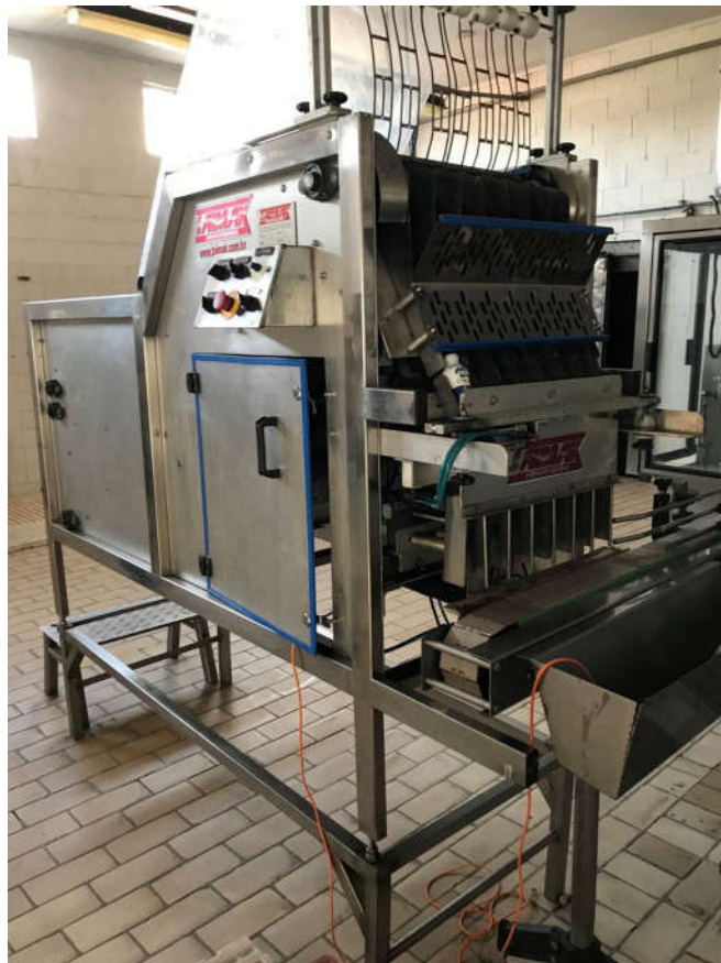
57 - POSICIONADOR DE GARRAFA MARCA "TAIMAK" EM INOX