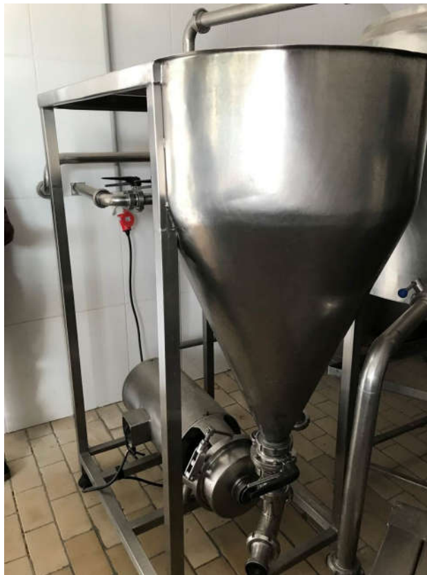
11 - TRIBLENDER EM INOX