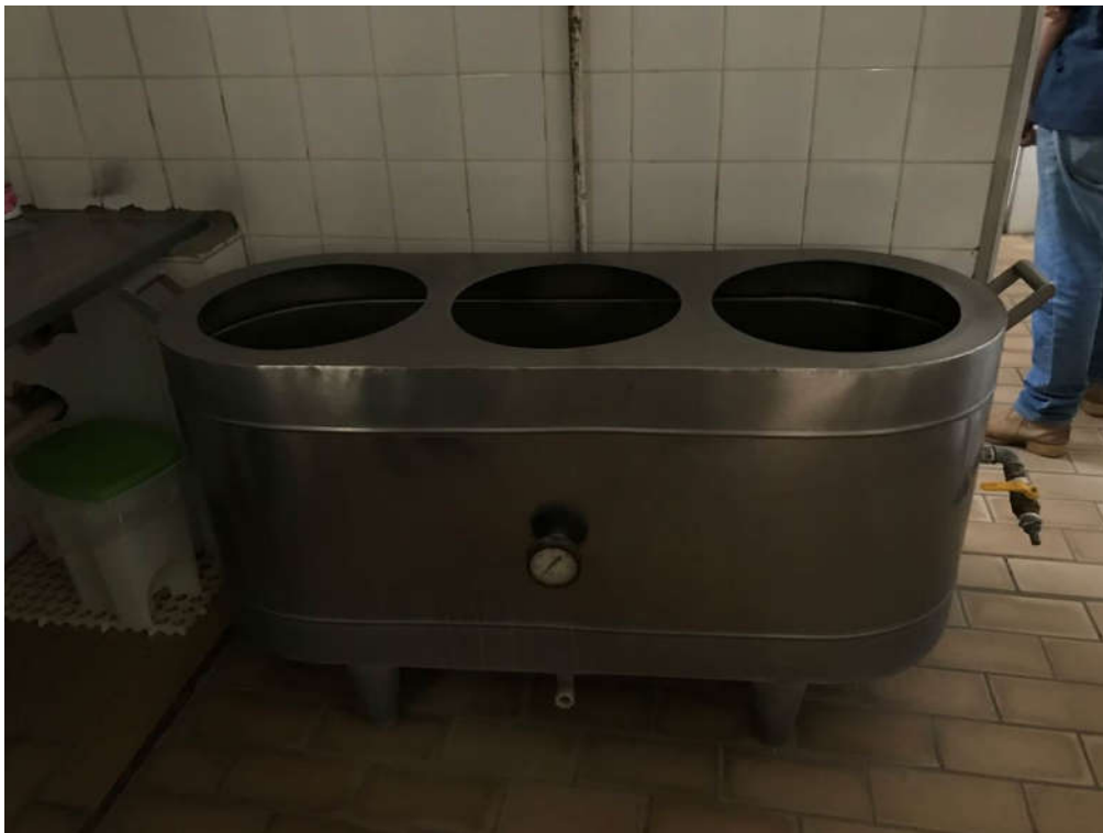
19 - INCUBADORA TIPO BANHO-MARIA