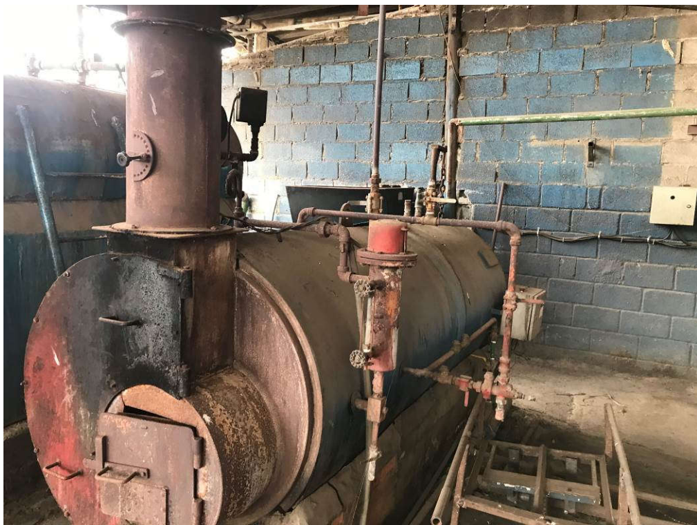
2 - CALDEIRA 400 QUILOS VAPOR POR HORA MARCA MML