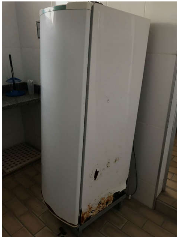
20 - REFRIGERADOR MARCA CONSUL