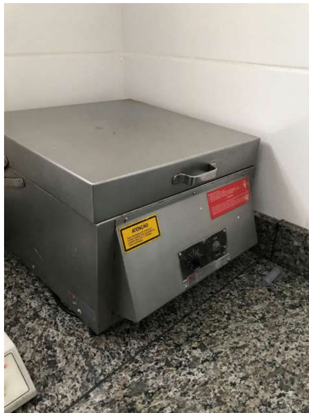
23 - ANALISADOR DE GORDURA MARCA CAP LAB