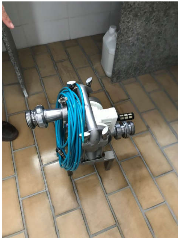
40 - BOMBA DE TRANSFERÊNCIA A AR