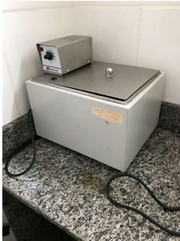
22 - BANHO MARIA