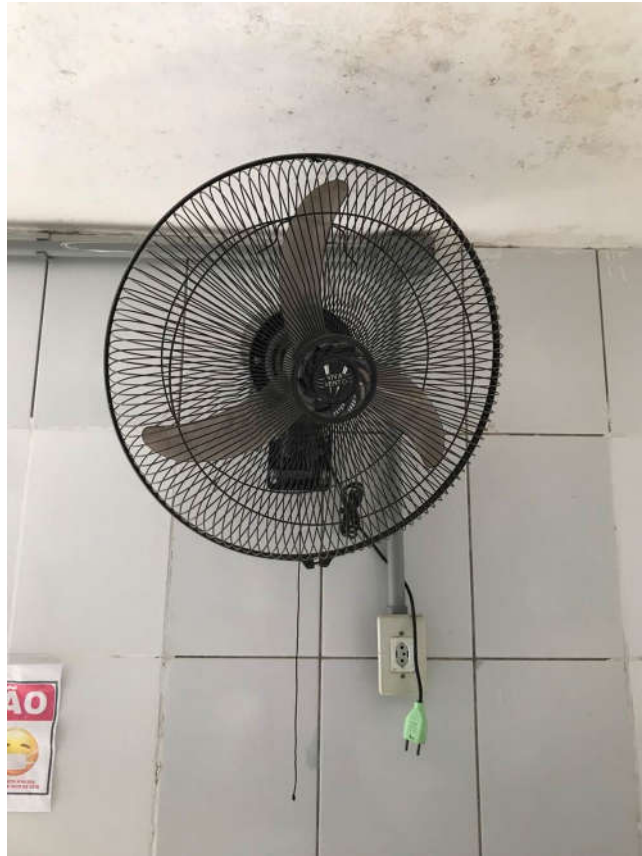
43 - VENTILADOR DE PAREDE MARCA VIVAVENTO