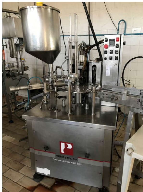
61 - MÁQUINA ENVASADORA PARA COPO MARCA PRIMO Y CIA. S/A