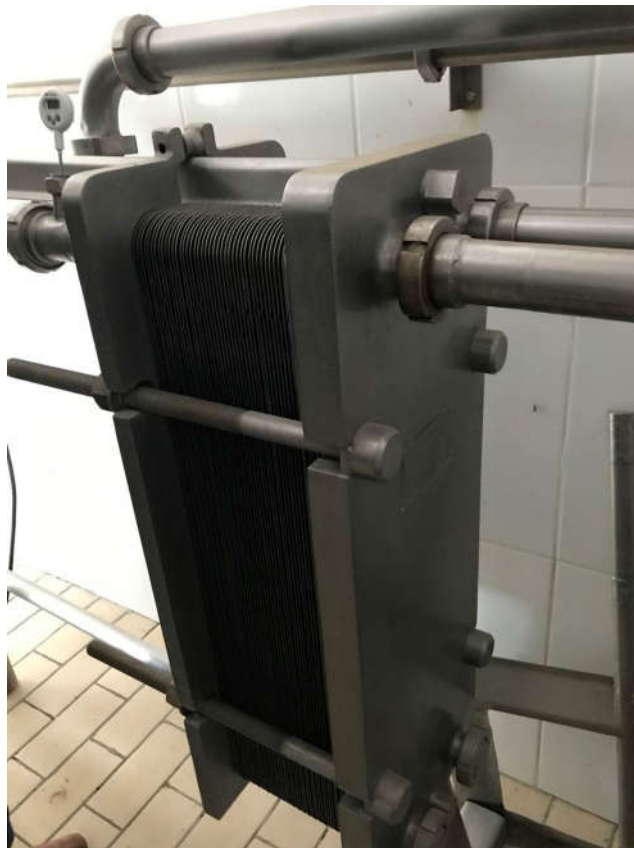
16 - PASTORIZADOR APV