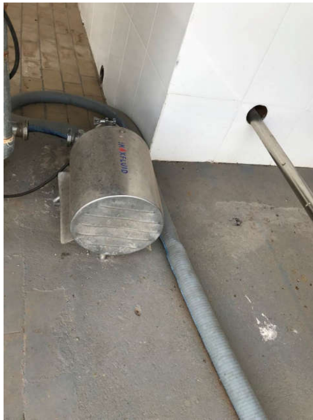
10 - BOMBA CENTRÍFUGA MARCA INOXFLUID