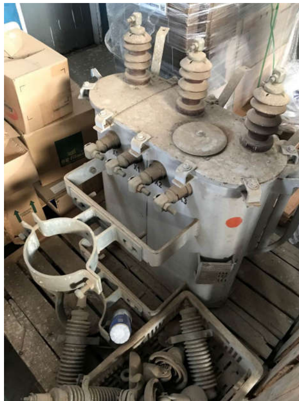
74 - TRANSFORMADOR INDUSTRIAL MARCA PAULISTA