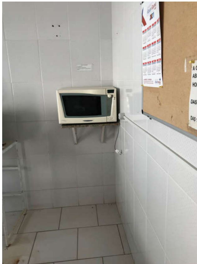
24 - FORNO MICROONDAS MARCA BRASTEMP