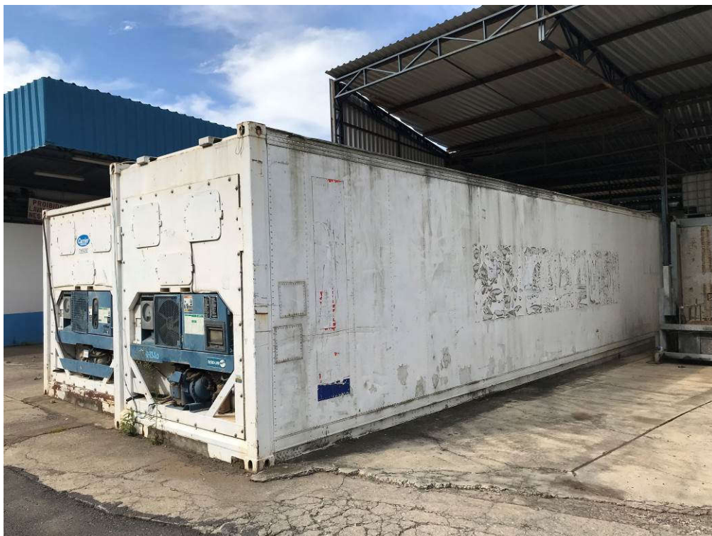
7 - CONTAINERS REFRIGERADOS MARCA CARRIER