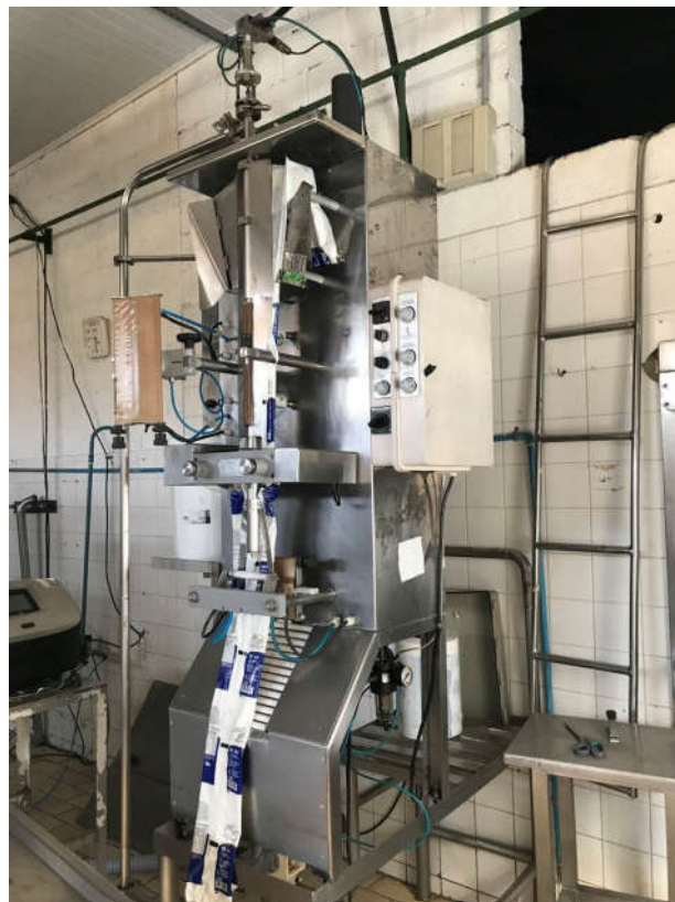
59 - MÁQUINA ENVASADORA TIPO BARRIGA MOLE MARCA MAGOPAC 2000S