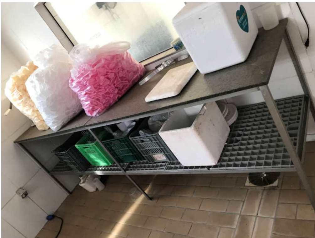
52 - MESA EM INOX E GRANITO, MEDINDO APROX. 3,60X0,60MTS