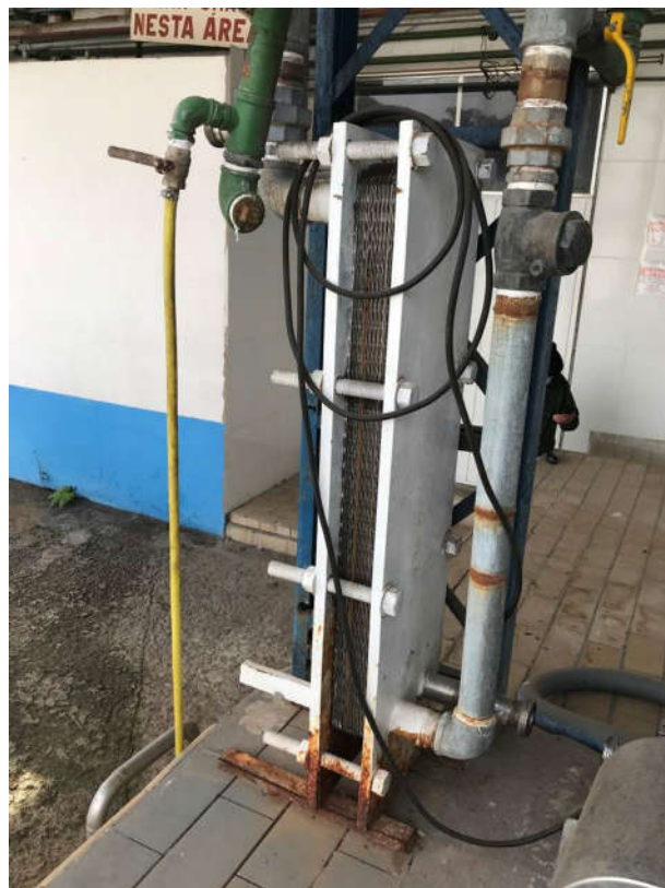
9 - RESFRIADOR A PLACAS