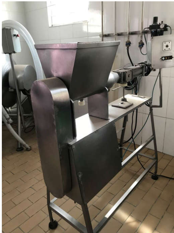
45 - DOSADOR DE MANTEIGA, EM INOX