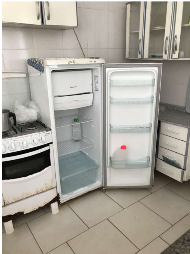
53 - REFRIGERADOR MARCA ELECTROLUX, MOD. SUPER RE28