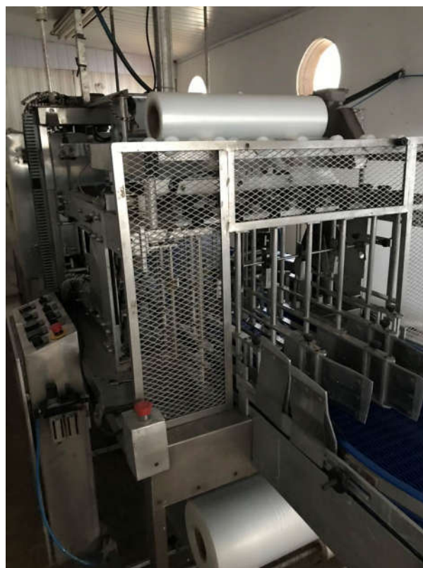
MÁQUINA ENFARDADEIRA INDUSTRIAL MARCA TAIMAK