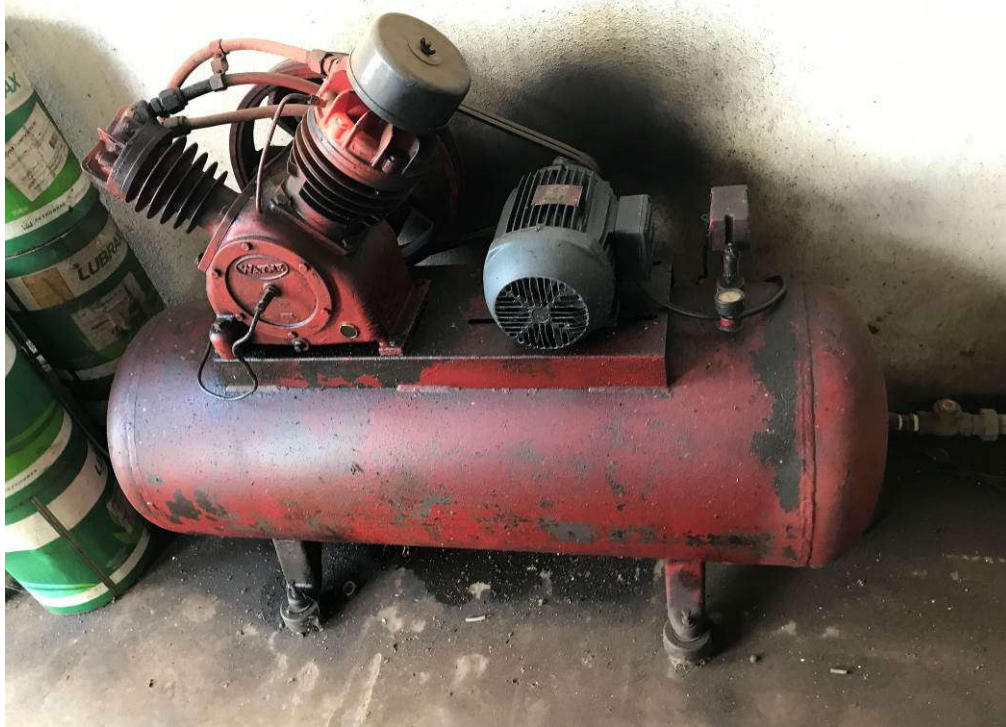
6 - COMPRESSOR MARCA WAYNE