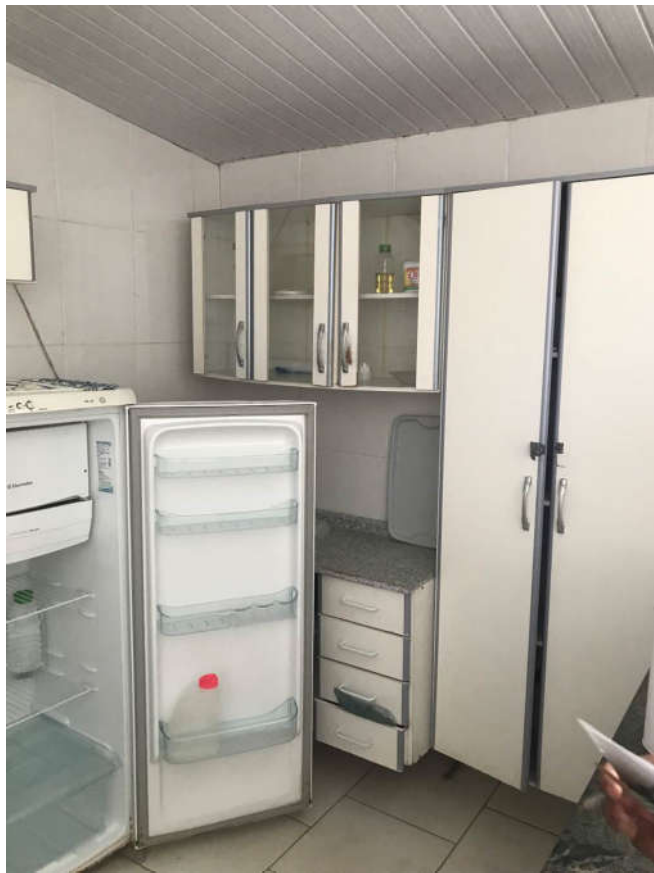
55 - ARMÁRIO DE COZINHA COMPOSTO DE 4 PEÇAS