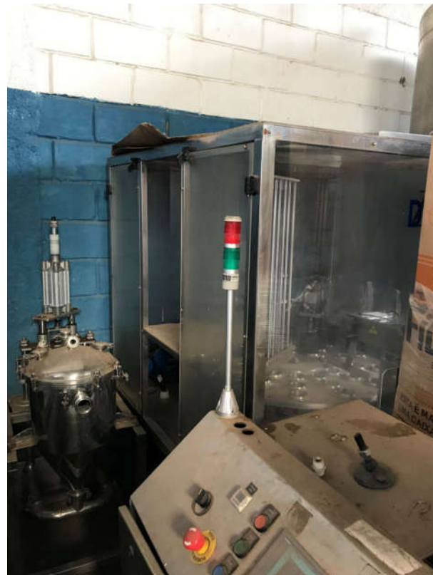
72 - ENVASADORA DE COPO MARCA "DMOM" EM INOX