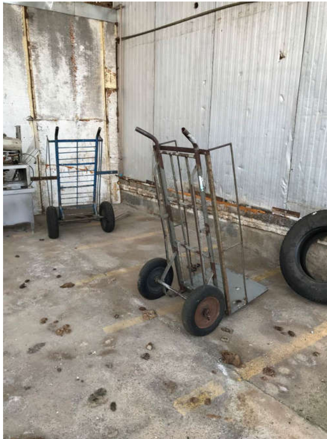
37 - CARRINHO DE CARGA COM PNEU