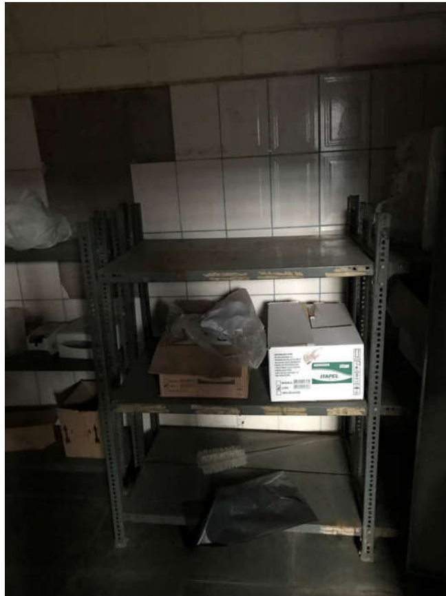
82 - PRATELEIRAS DE AÇO