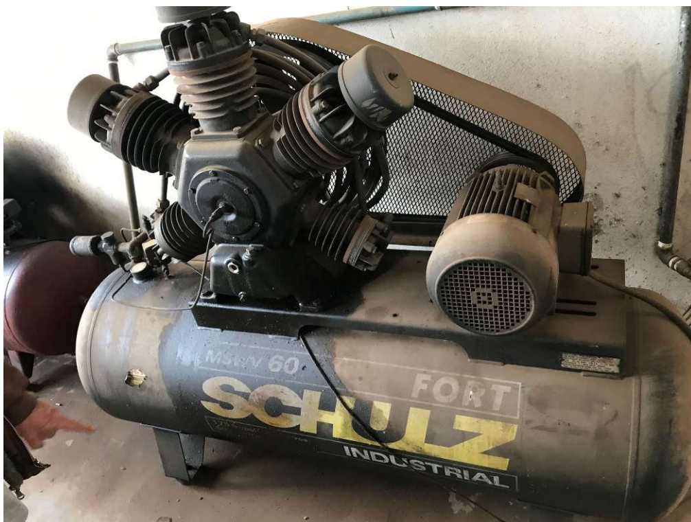
5 - COMPRESSOR MARCA SCHULZ