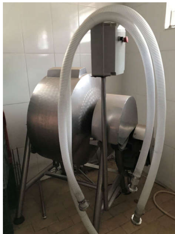
46 - BATEDEIRA DE MANTEIGA