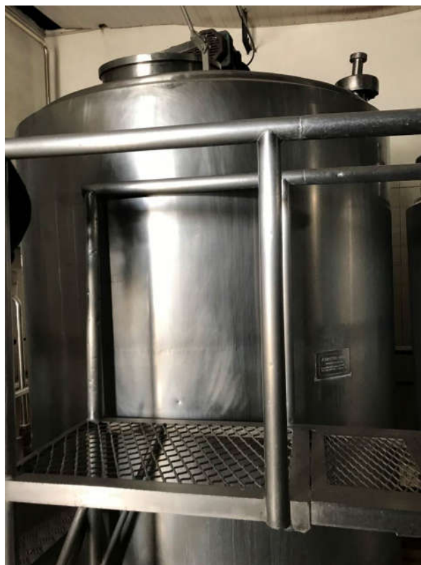
17 - IOGURTEIRAS EM INOX MARCA ARTE SUL