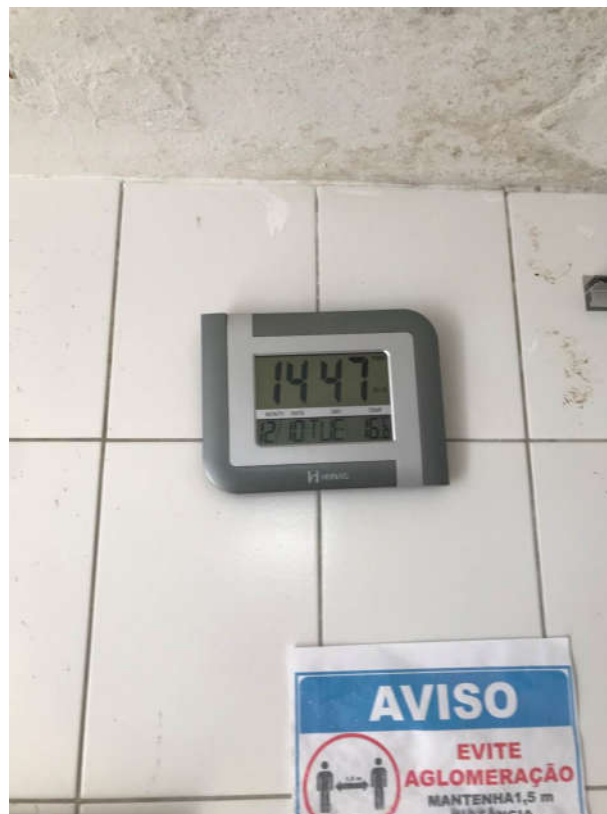
44 - RELÓGIO DE PAREDE MARCA HERWEG DIGITAL