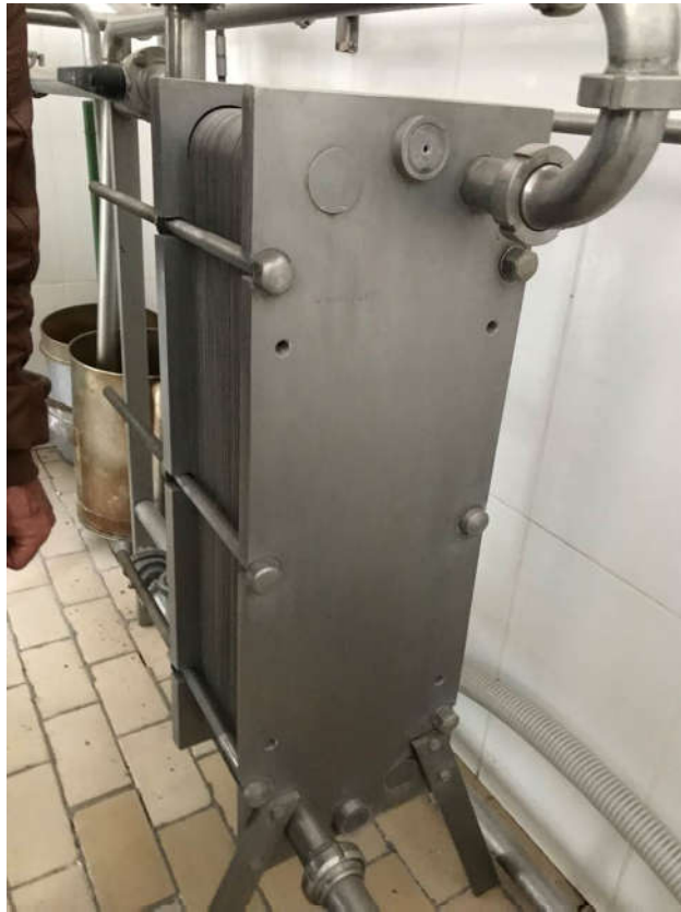
14 - PASTORIZADOR