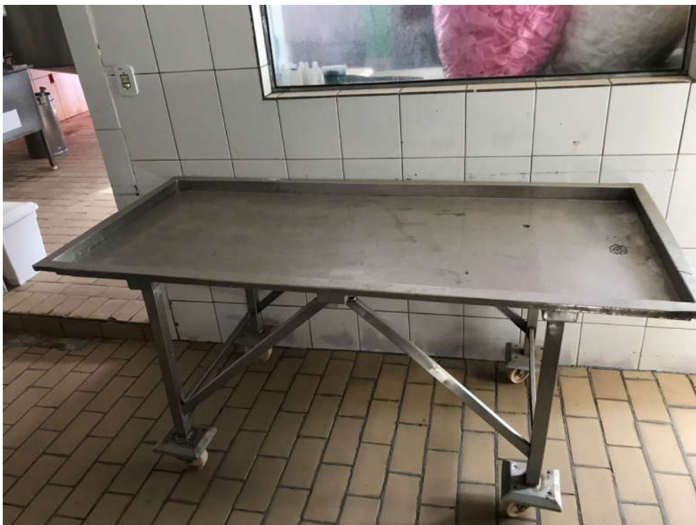
42 - MESA INOX MEDINDO APROX. 20,50X0,80MTS