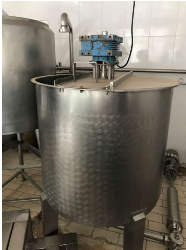
12 - TANQUE PULMÃO EM INOX, 500L CAMISA SIMPLES