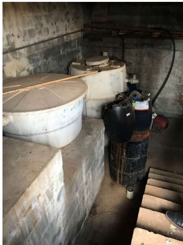
36 - CONJUNTO DE TRATAMENTO DE EFLUENTES COM 03 TANQUES