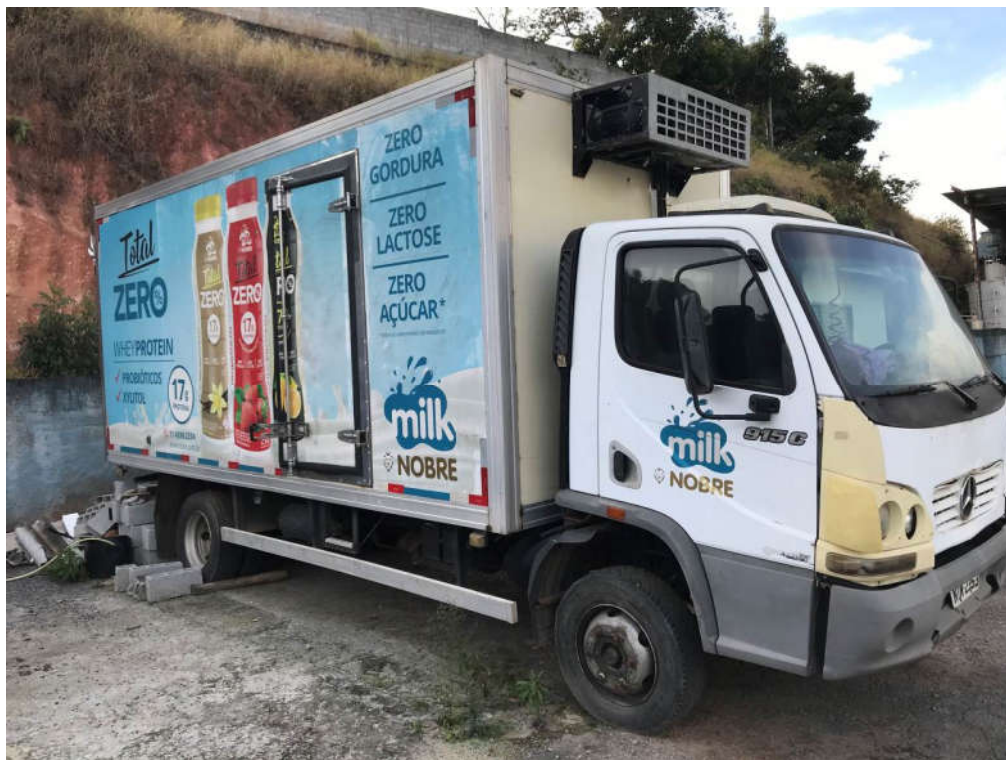
84 - CAMINHÃO REFRIGERADO BAÚ MARCA "MERCEDDES BENZ" MOD. 915C