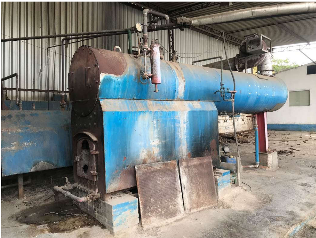
1 - CALDEIRA 600 QUILOS VAPOR POR HORA MARCA SANTESSO