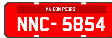
Placa NNC5854 - Placa FIPE