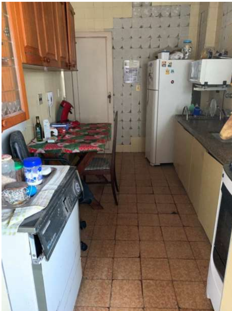
Foto 23 – Vista na direção contrária à fotografia anterior; pode-se visualizar também o mesmo destacamento do revestimento de azulejoa da outra parede da cozinha, na fotografia anterior.