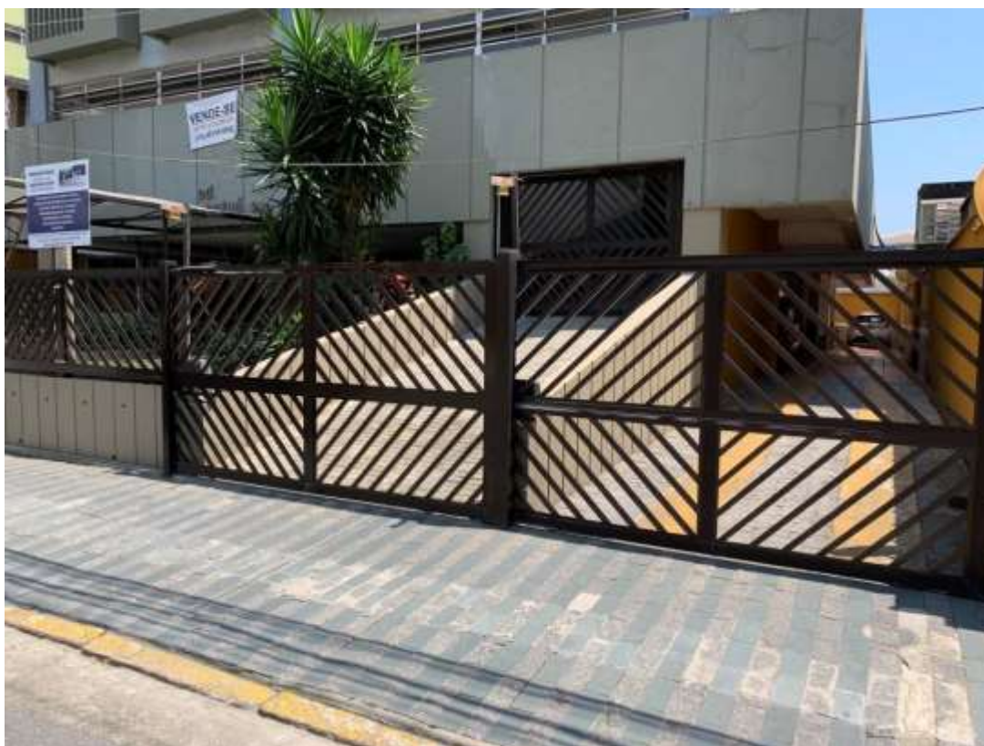
Foto 3 – Rampa de acesso ao mezanino para entrada e saída da garagem coletiva; ao lado acesso à garagem térrea.