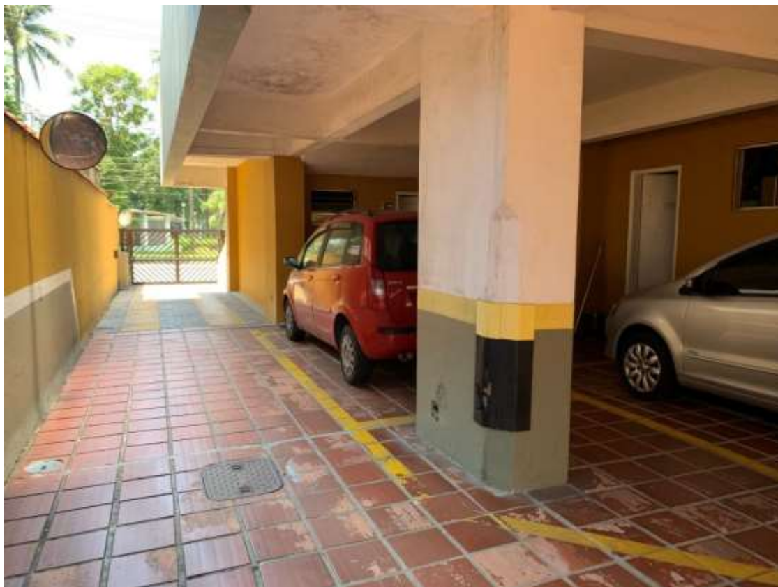
Foto 9 – Acesso à garagem térrea, vista de dentro do Edifício Catuá.