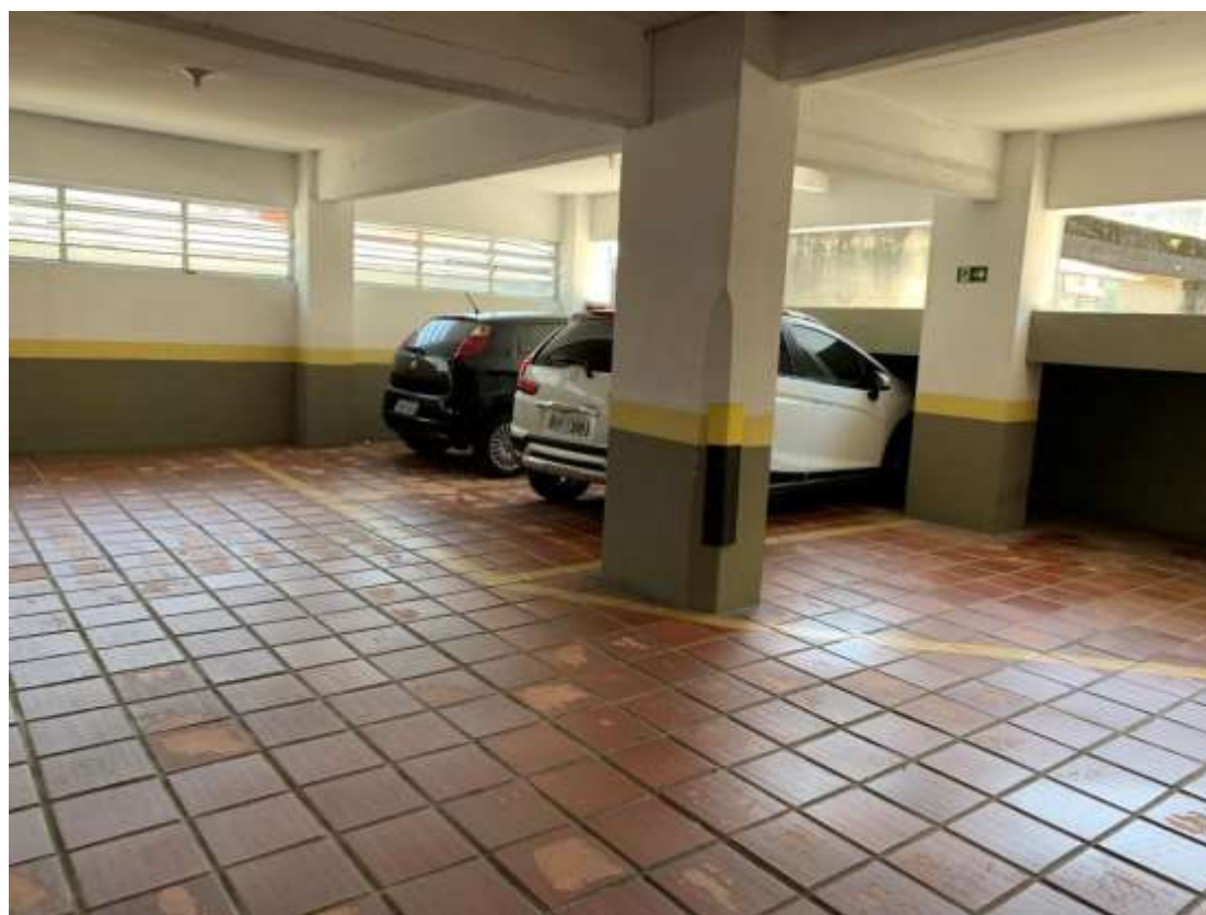
Fotos 7 e 8 – Lado oposto, com o restante das vagas de garagem do mezanino.