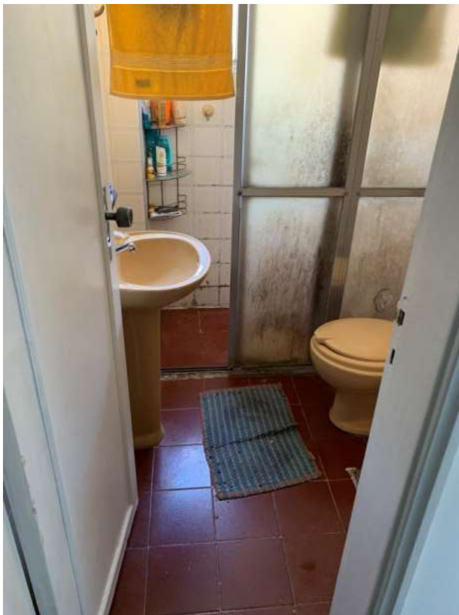
Foto 18 - Vista do banheiro social.