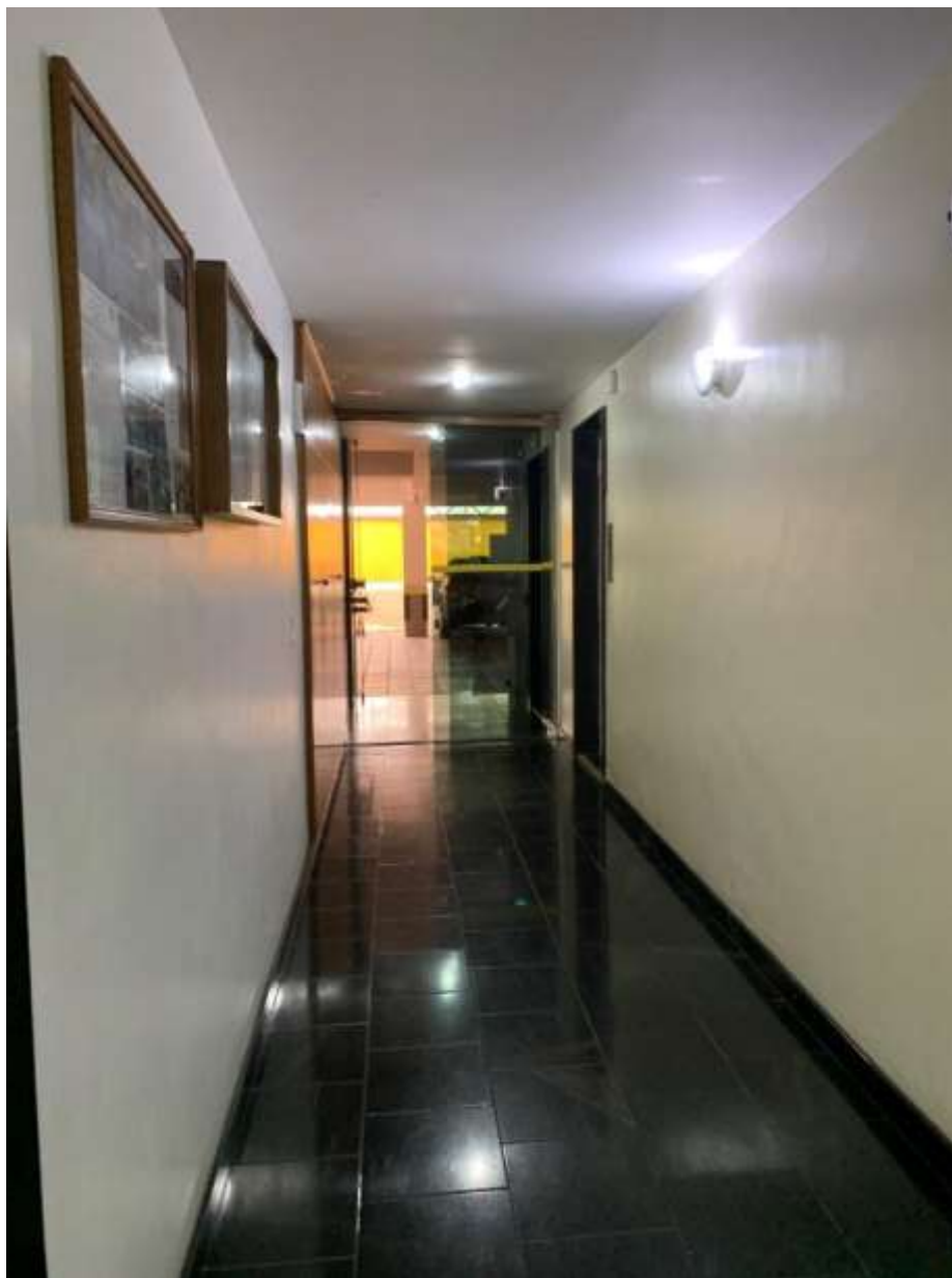
Foto 12 – Corredor de acesso aos elevadores do Condomínio Edifício Catuá em São Vicente/SP; ao fundo, as vagas de garagem do térreo.