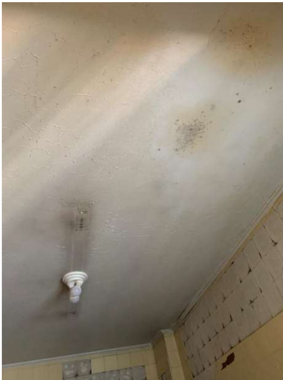
Foto 24 – Teto da cozinha com alguma infiltração difusa; visualiza-se também o destacamento do revestimento de azulejo já mencionado nas fotografias anteriores.