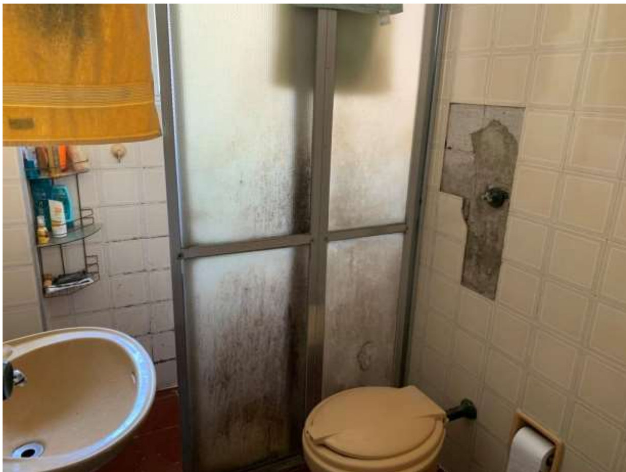
Foto 19 - Vista ampliada do banheiro social, pela qual pode-se visualizar a falta de alguns azulejos na parede.