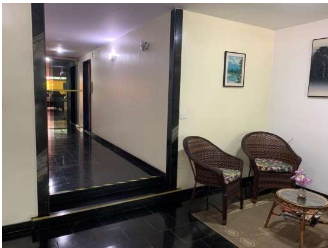
Foto 11 – Hall de Entrada do Condomínio Edifício Catuá em São Vicente/SP.