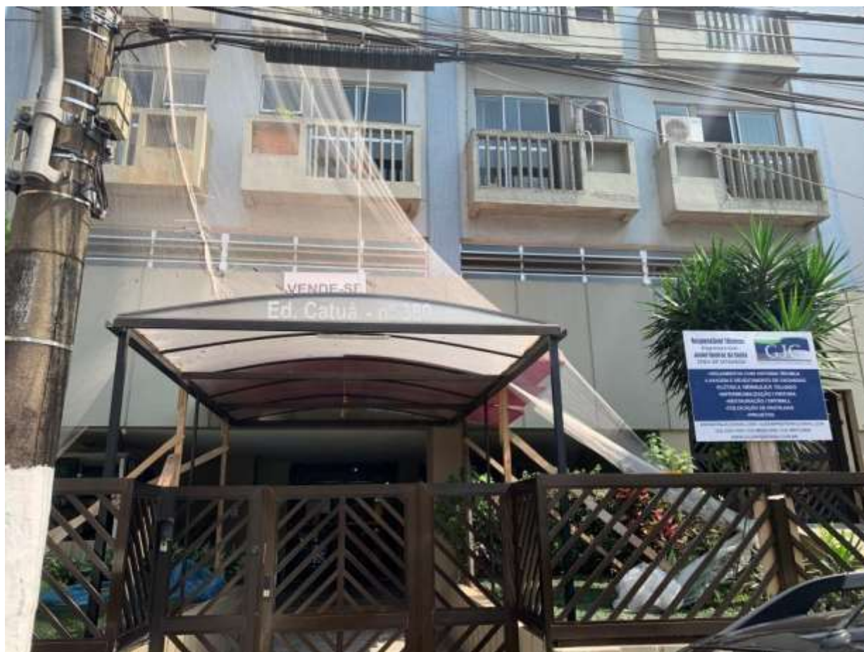
Foto 2 – Parte da fachada e identificação do Cond. Edifício Catua, nº 380 da Praça 22 de Janeiro em São Vicente/SP