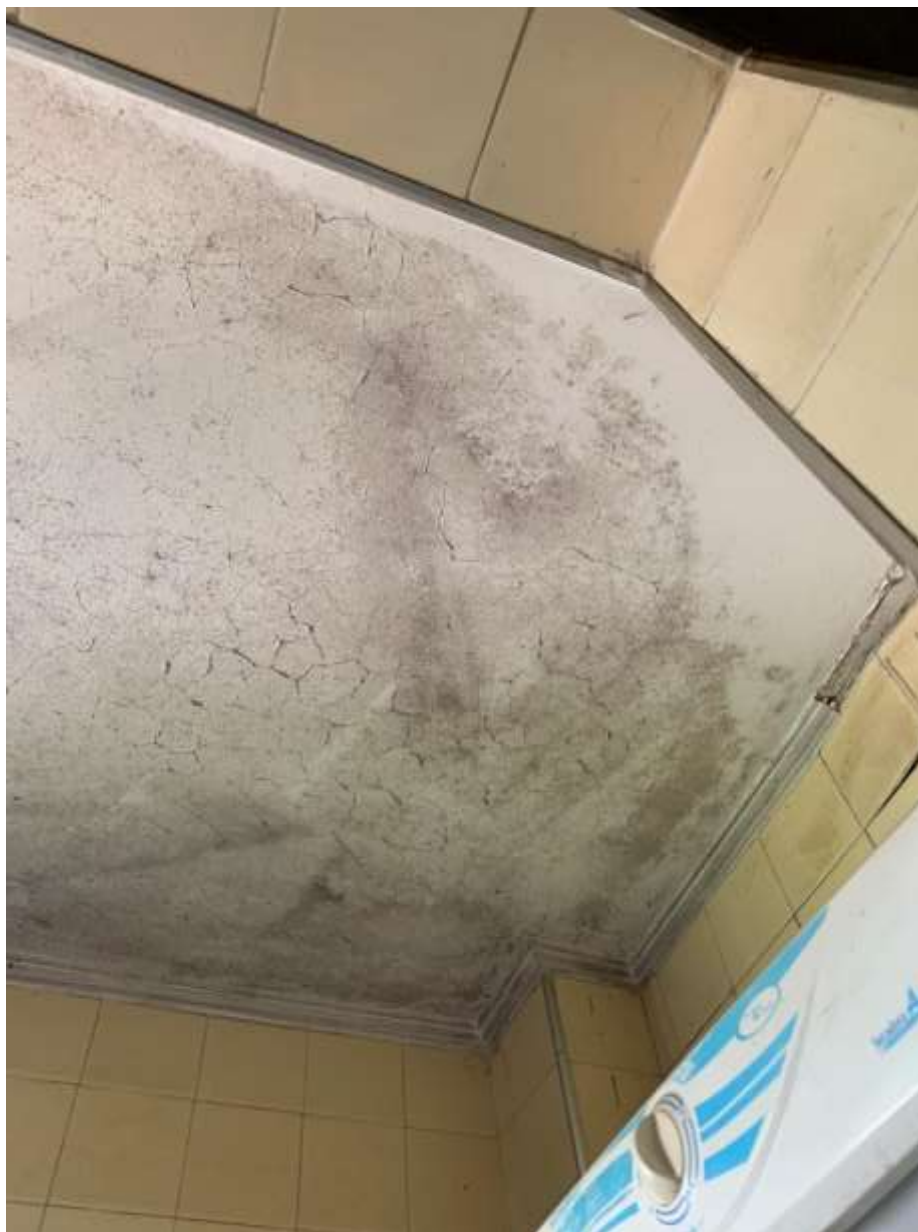
Foto 27 – Outra parte do teto mostrando infiltração difusa do teto da área de serviço do apartamento avaliando.