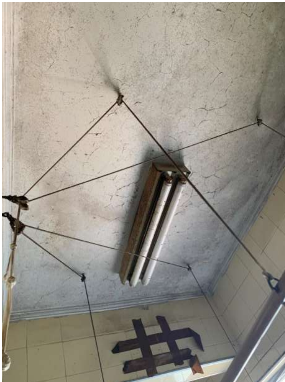
Foto 26 – Infiltração difusa no teto da área de serviço do apartamento avaliando.