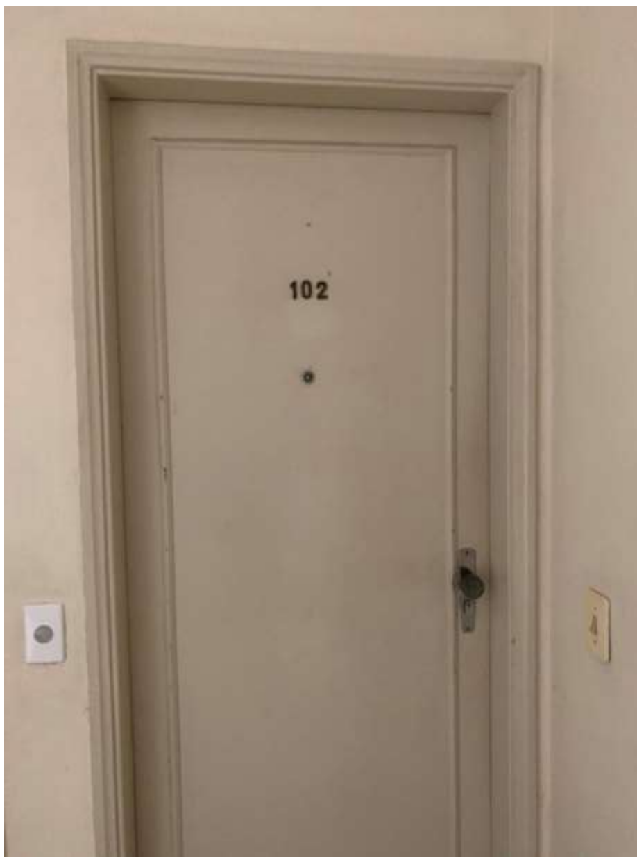
Foto 13 – Única porta de entrada e acesso ao apartamento avaliando, nº 102.