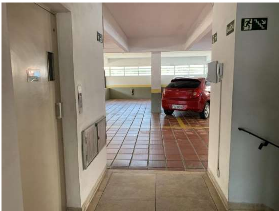
Foto 4 – Acesso à garagem coletiva do mezanino por elevador ou escada.