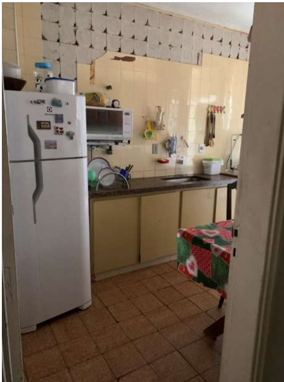
Foto 22 – Vista de parte da cozinha em direção à área de serviço; pode-se visualizar o destacamento de parte do revestimento de azulejos da parede, requerendo reposição ou substituição total.