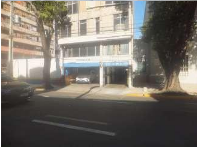
Vista de entrada para as garagens