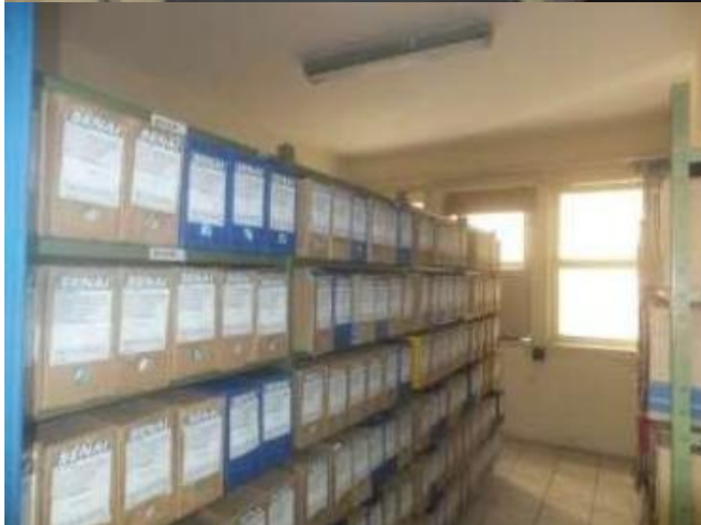
Vista interna de sala no 3º pavimento