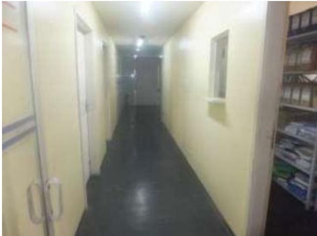
Vista interna de circulação no 5º pavimento