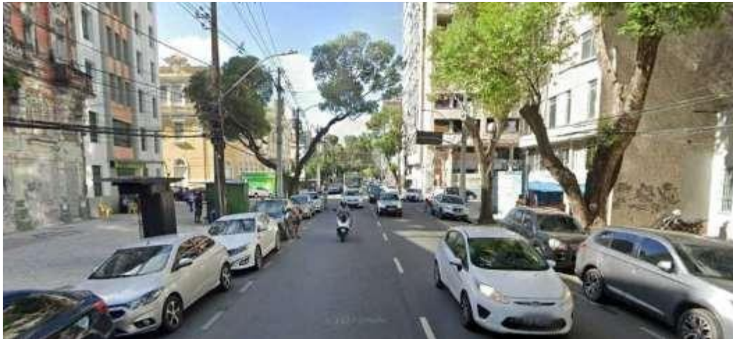
Logradouro Frente: Rua Imp. Dom Pedro II