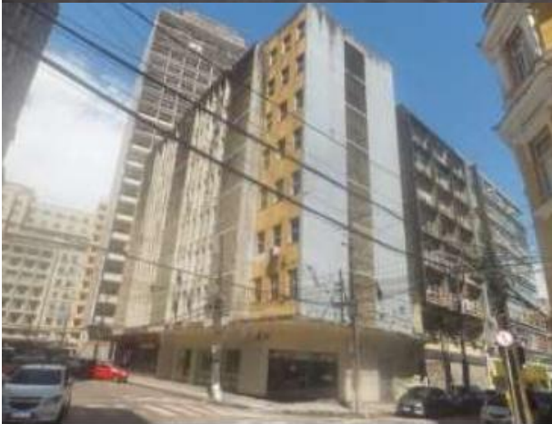
Lateral dieito: Eng o Ubaldo Gomes de Matos Fachada Principal: Edf. Limoeiro