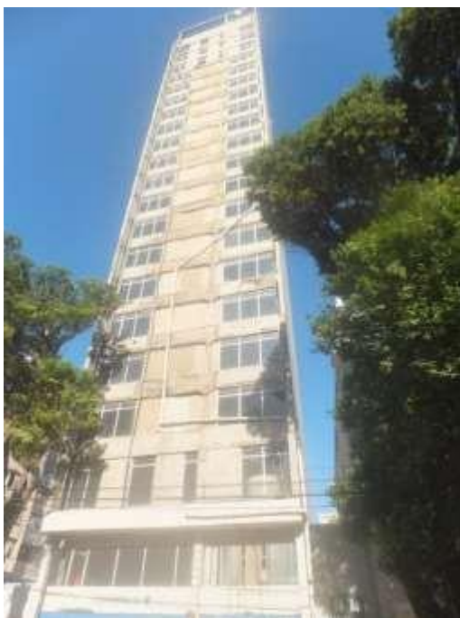
Fachada principal – Ed. Piratininga