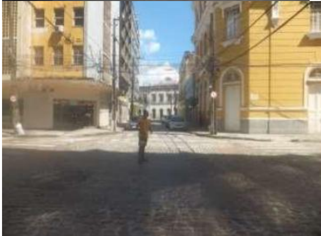
Logradouro: Av. Marquês do Recife PE