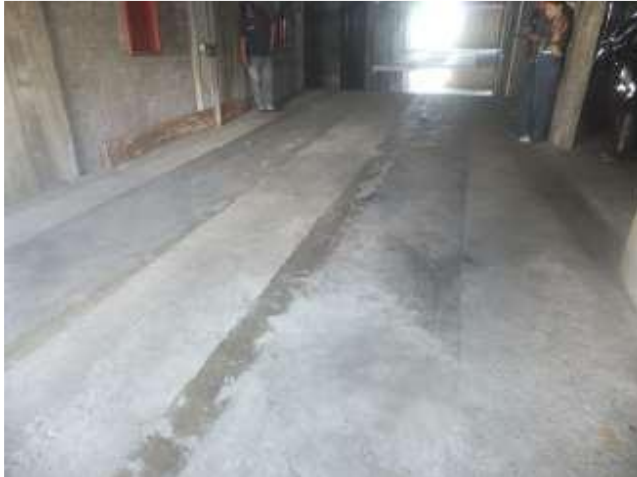
Vista de vagas de garagens