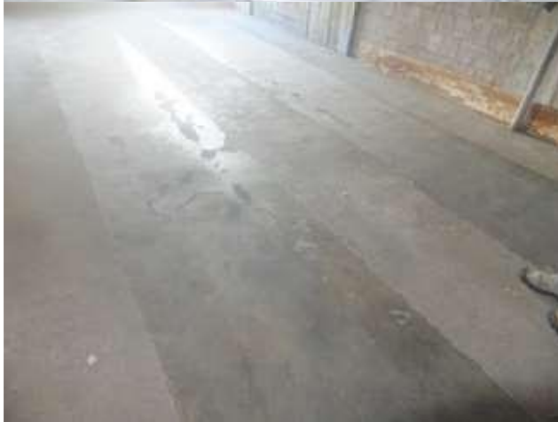
Vista da entrada principal para plataforma