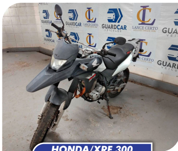
HONDA/XRE 300 2015/2015