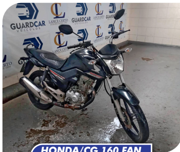
HONDA/CG 160 FAN ESDI 2016/2016