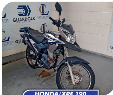
HONDA/XRE 190 2019/2019

PARA PARTICIPAR CADASTRE-SE COM ANTECEDÊNCIA