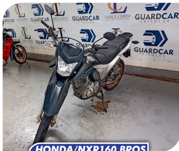
HONDA/NXR160 BROS ESDD2015/2015