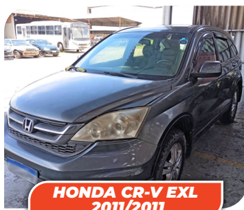
HONDA CR-V EXL 2011/2011