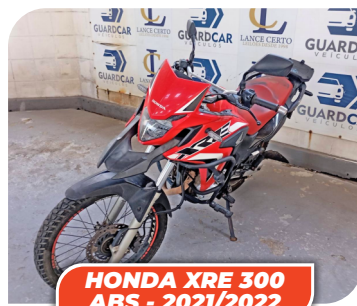
HONDA XRE 300 ABS - 2021/2022

PARA PARTICIPAR CADASTRE-SE COM ANTECEDÊNCIA