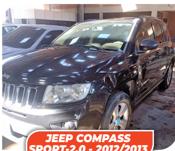
JEEP COMPASS SPORT-2.0 - 2012/2013