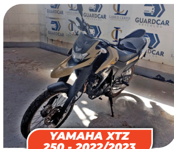
YAMAHA XTZ 250 - 2022/2023