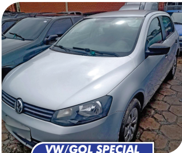
VW/GOL SPECIAL MB 2014/2015