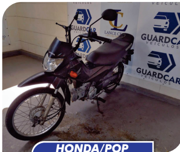
HONDA/POP 110I 2017/2018