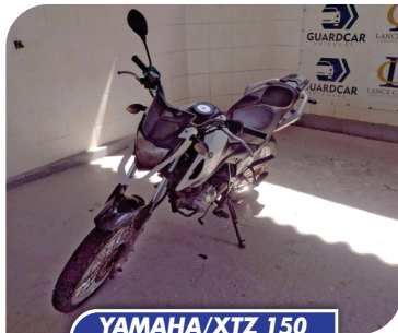
YAMAHA/XTZ 150 CROSSER 2014/2015