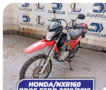
HONDA/NXR160 BROS ESDD 2018/2018

PARA PARTICIPAR CADASTRE-SE COM ANTECEDÊNCIA