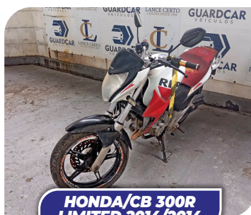
HONDA/CB 300R LIMITED 2014/2014