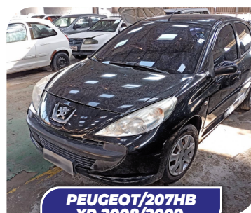
PEUGEOT/207HB XR 2008/2009