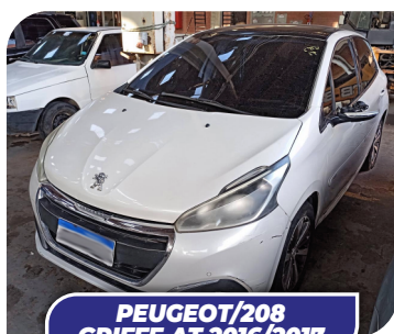
PEUGEOT/208 GRIFTE AT 2016/2017