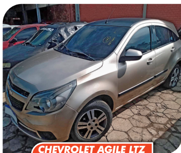
CHEVROLET AGILE LTZ 2013/2013