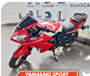
YAMASAKI SPORT ROAD B - 2014/2014