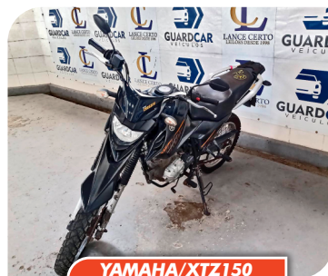
YAMAHA/XTZ150 CROSSER Z 2019/2019

PARA PARTICIPAR CADASTRE-SE COM ANTECEDÊNCIA