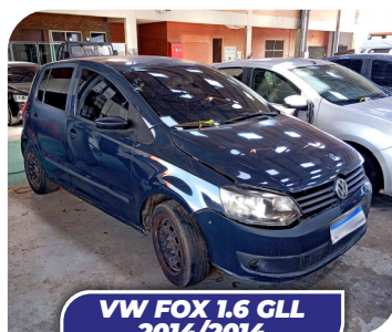
VW FOX 1.6 GLL 2014/2014