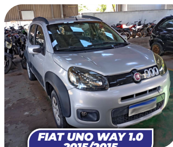
FIAT UNO WAY 1.0 2015/2015

PARA PARTICIPAR CADASTRE-SE COM ANTECEDÊNCIA