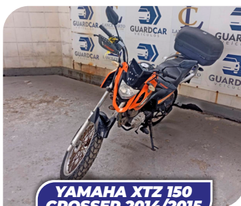
YAMAHA XTZ 150 CROSSER 2014/2015