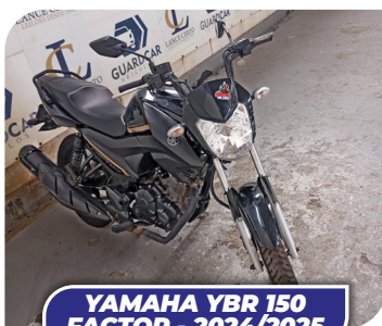
YAMAHA YBR 150 FACTOR - 2024/2025