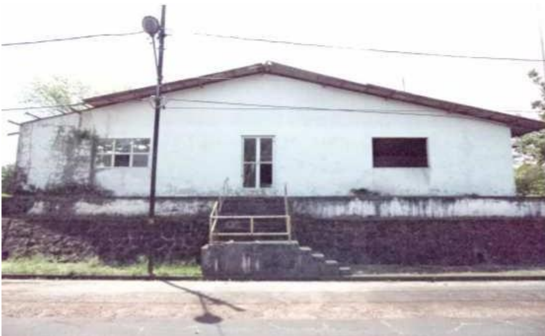
Figura 21 - Galpão em péssimo estado de conservação.