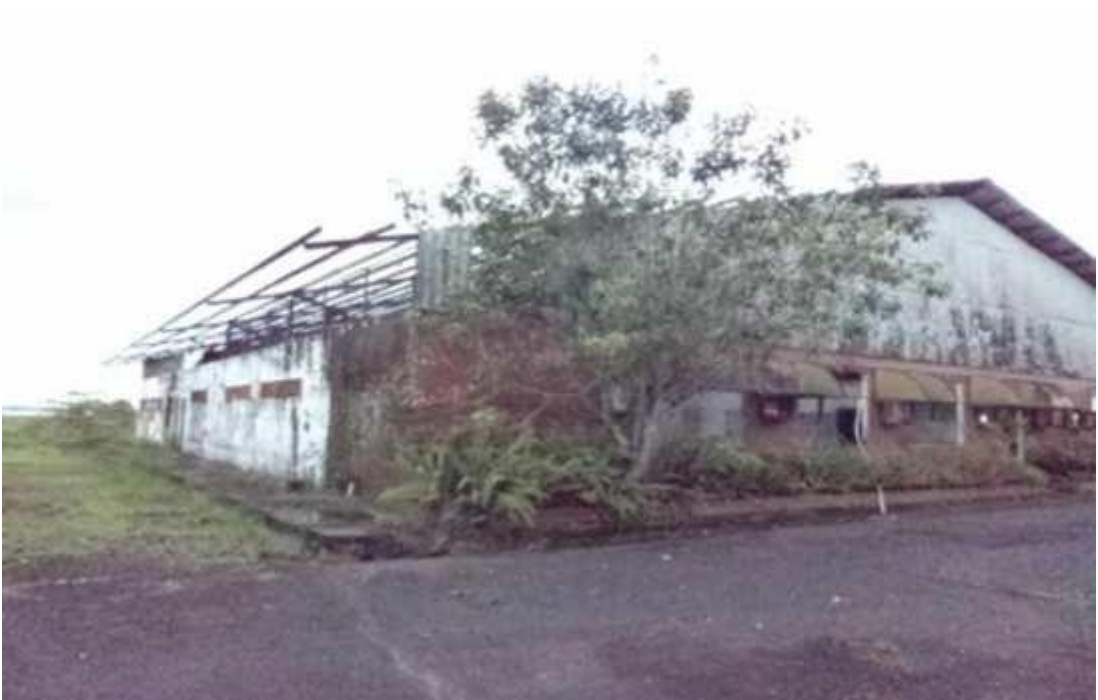
Figura 11 - Galpão em estado de conservação regular.