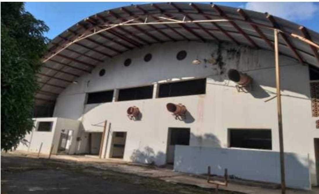
Figura 9 - Galpão com dois pavimentos, em estado regular de conservação.