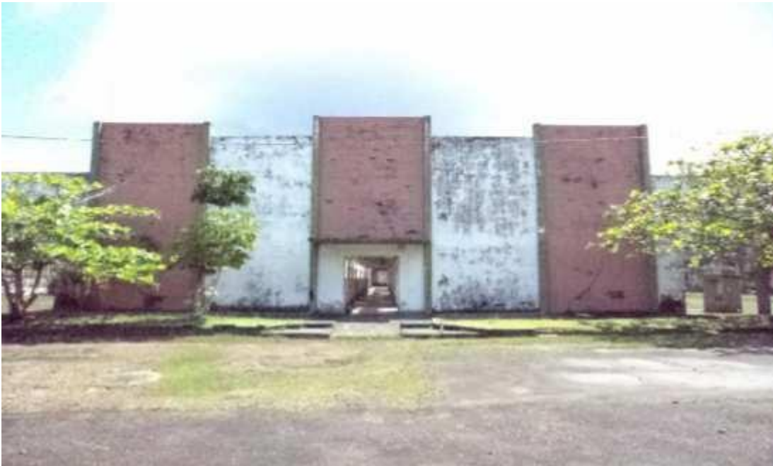
Figura 8 - Galpão em péssimo estado de conservação.