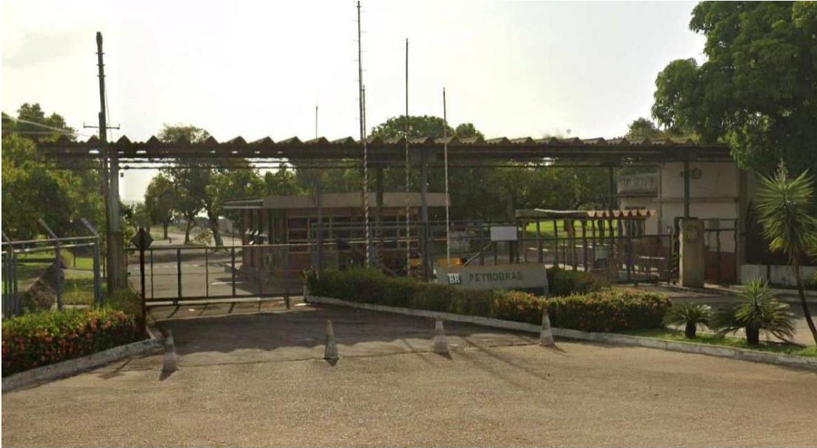
Figura 2 - Portaria de entrada do imóvel Base Tapanã, na área urbana de Belém - PA.