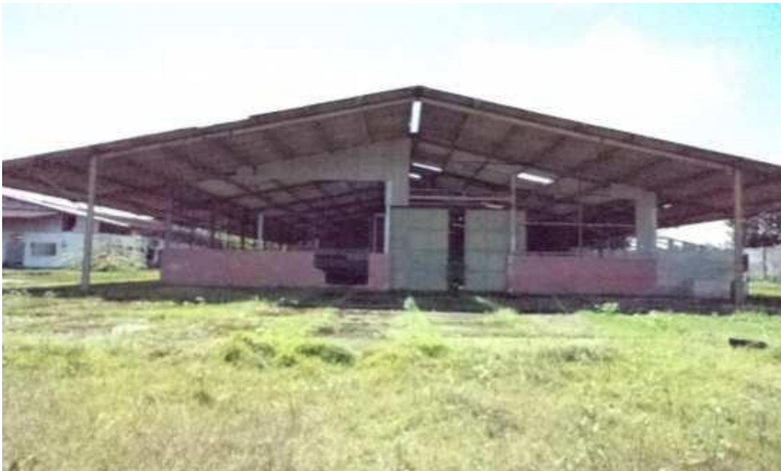
Figura 12 - Galpão em estado de conservação regular.