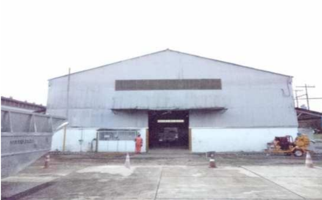
Figura 18 - Galpão em bom estado de conservação.