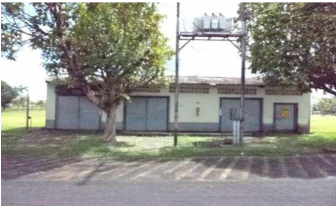
Figura 16 - Galpão em bom estado de conservação.