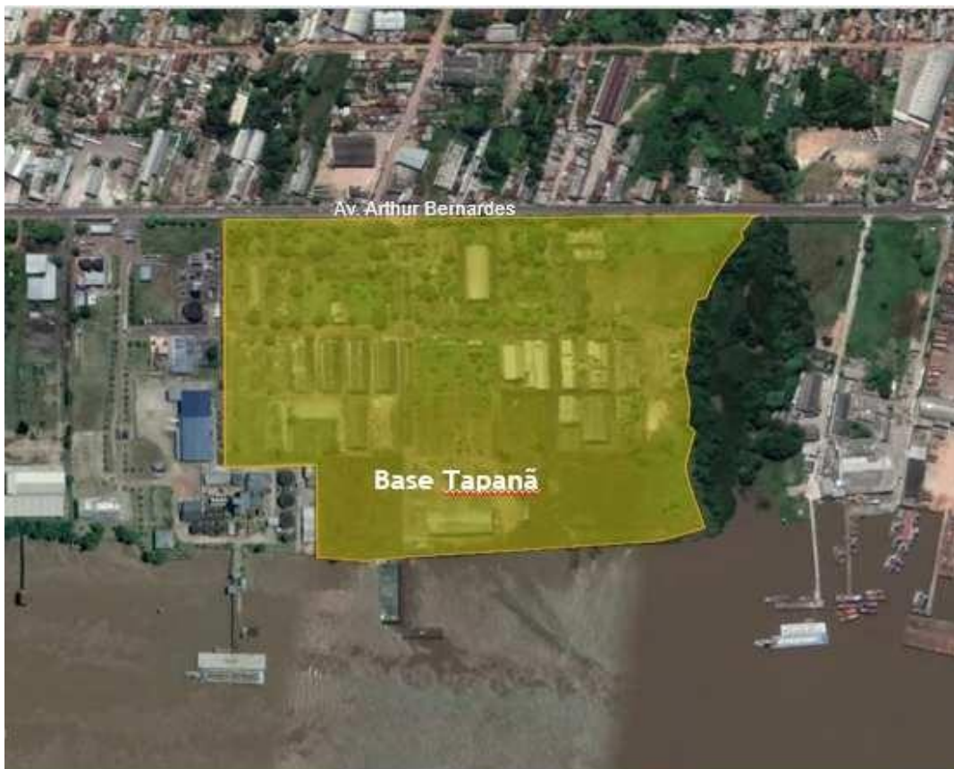
Figura 1 - Mapa de localização do imóvel onde está localizada a Base Tapanã, na área urbana de Belém - PA.