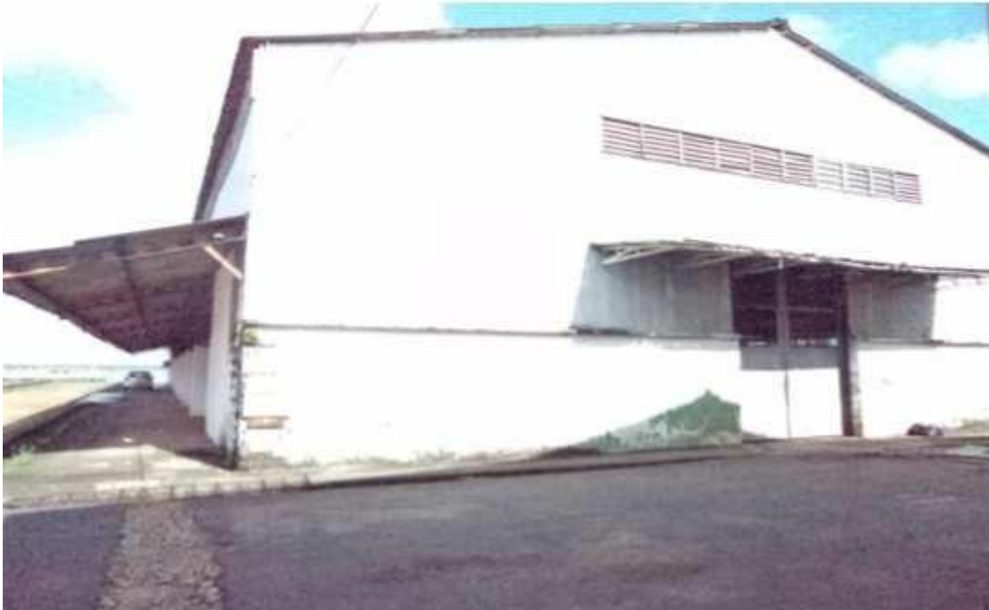
Figura 20 - Galpão em bom estado de conservação.