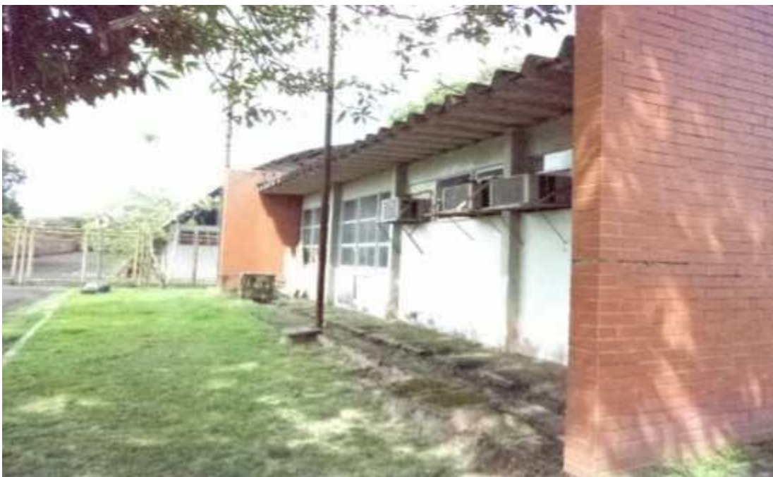
Figura 15 - Galpão em bom estado de conservação.