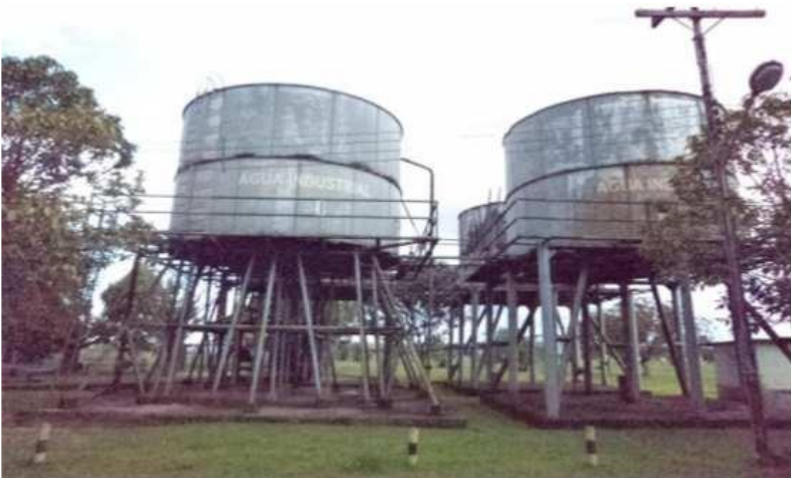
Figura 3 - 04 Caixas d'água.