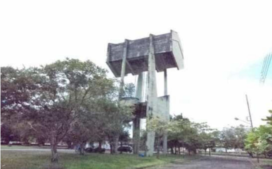
Figura 4 - Caixa d'água com estrutura de concreto.