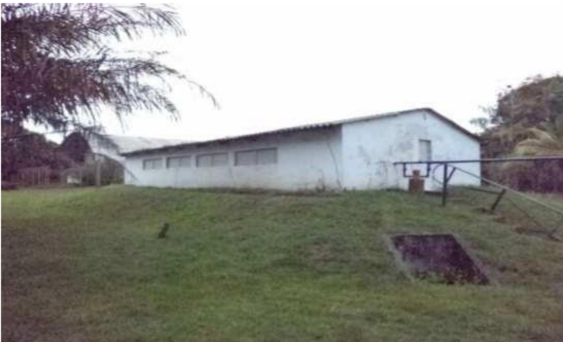
Figura 5 - Cisterna.