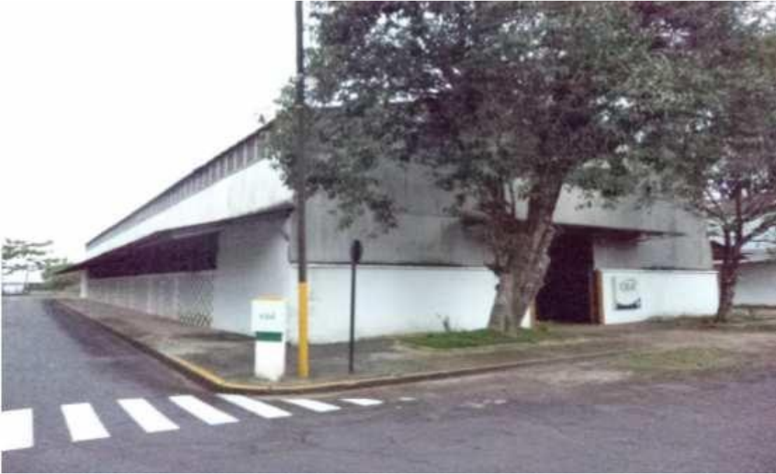
Figura 22 - Galpão em bom estado de conservação.