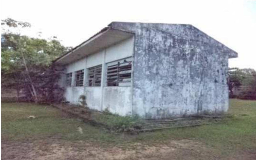
Figura 14 - Galpão em estado de conservação precário.