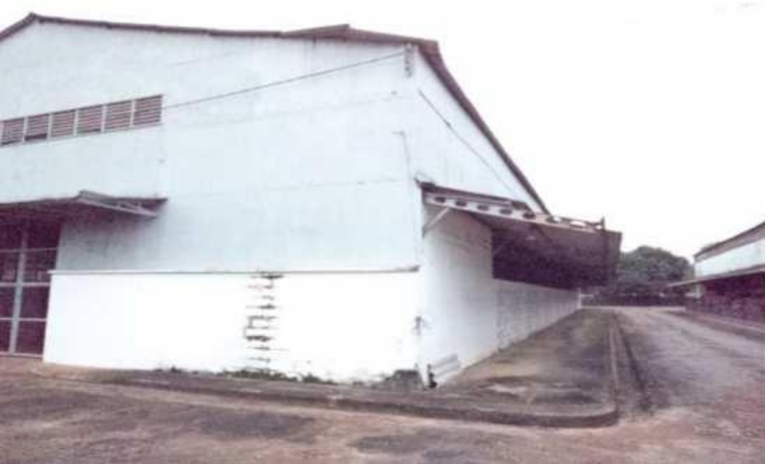
Figura 23 - Galpão em bom estado de conservação.