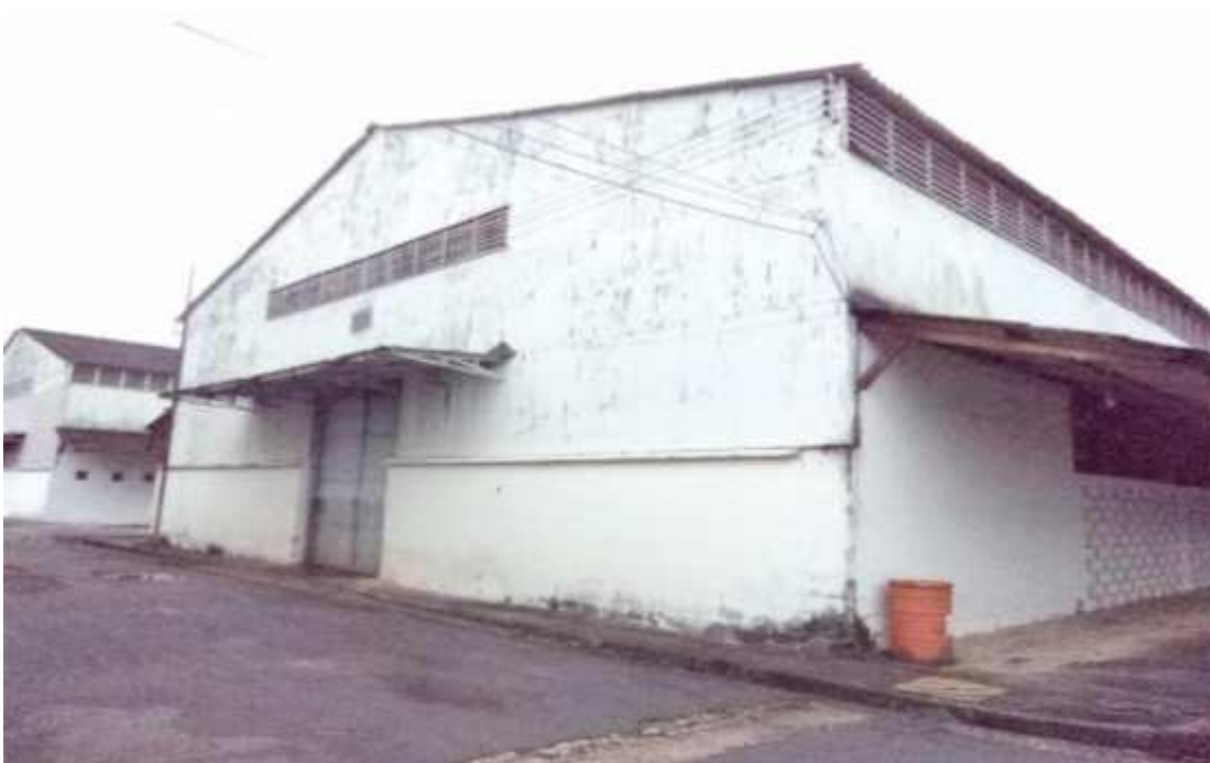
Figura 19 - Galpão em bom estado de conservação.