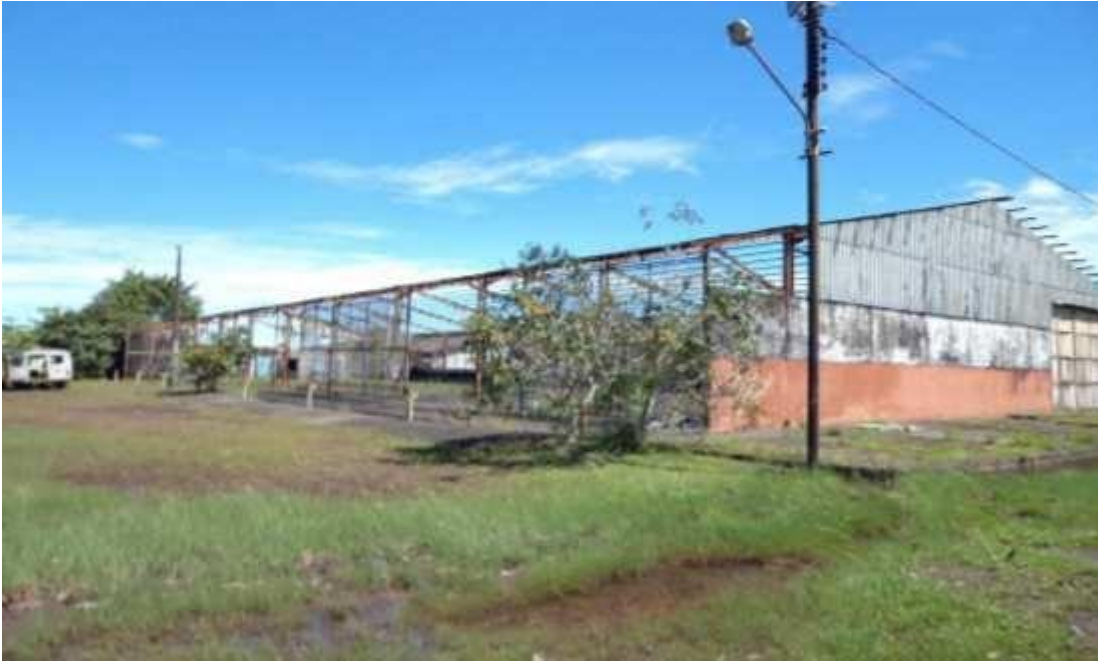
Figura 10 - Galpão em estado precário de conservação.