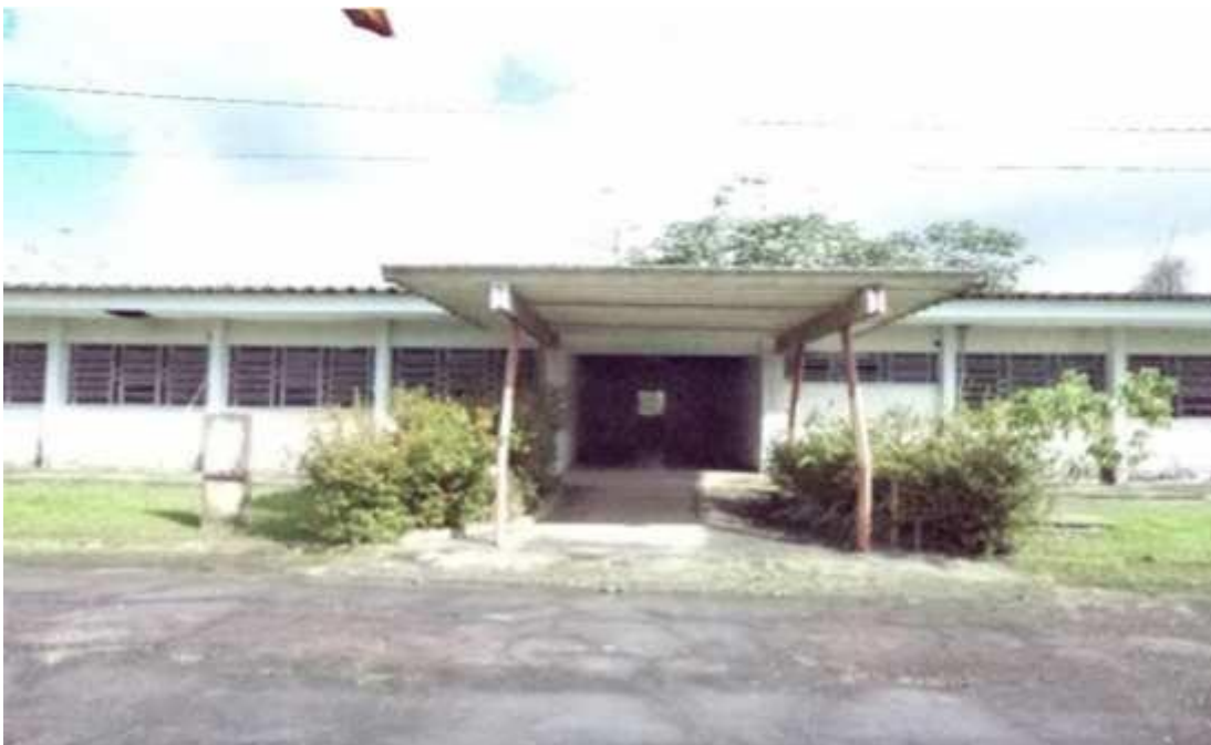
Figura 13 - Galpão em estado de conservação regular.