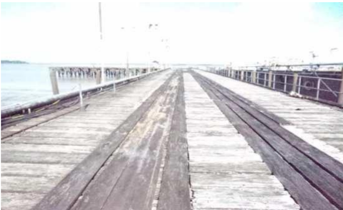
Figura 25 - Píer.