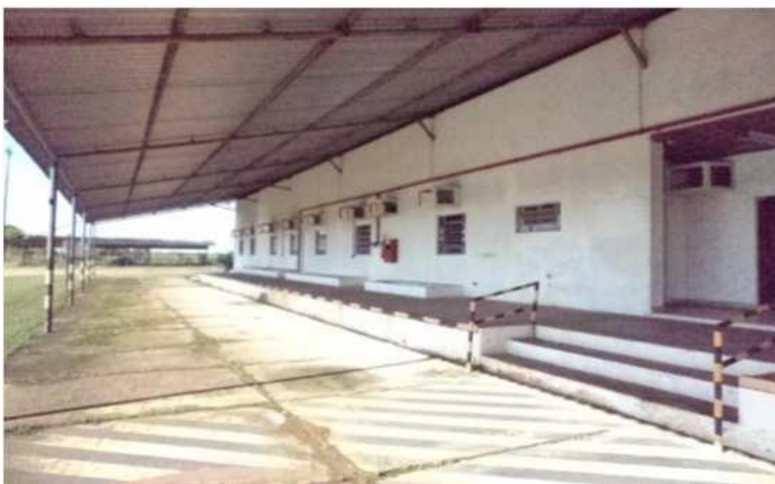
Figura 17 - Galpão em bom estado de conservação.