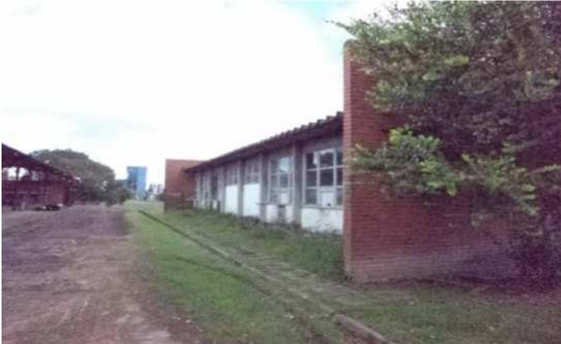
Figura 24 - Galpão em estado de conservação regular.