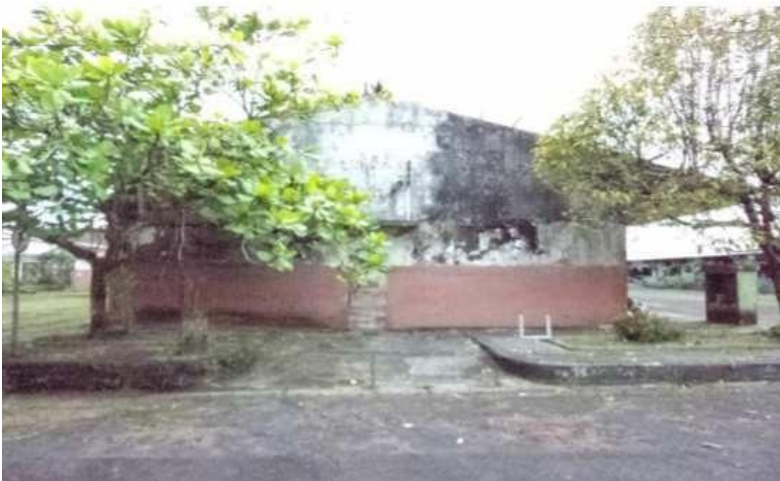
Figura 7 - Galpão em péssimo estado de conservação.