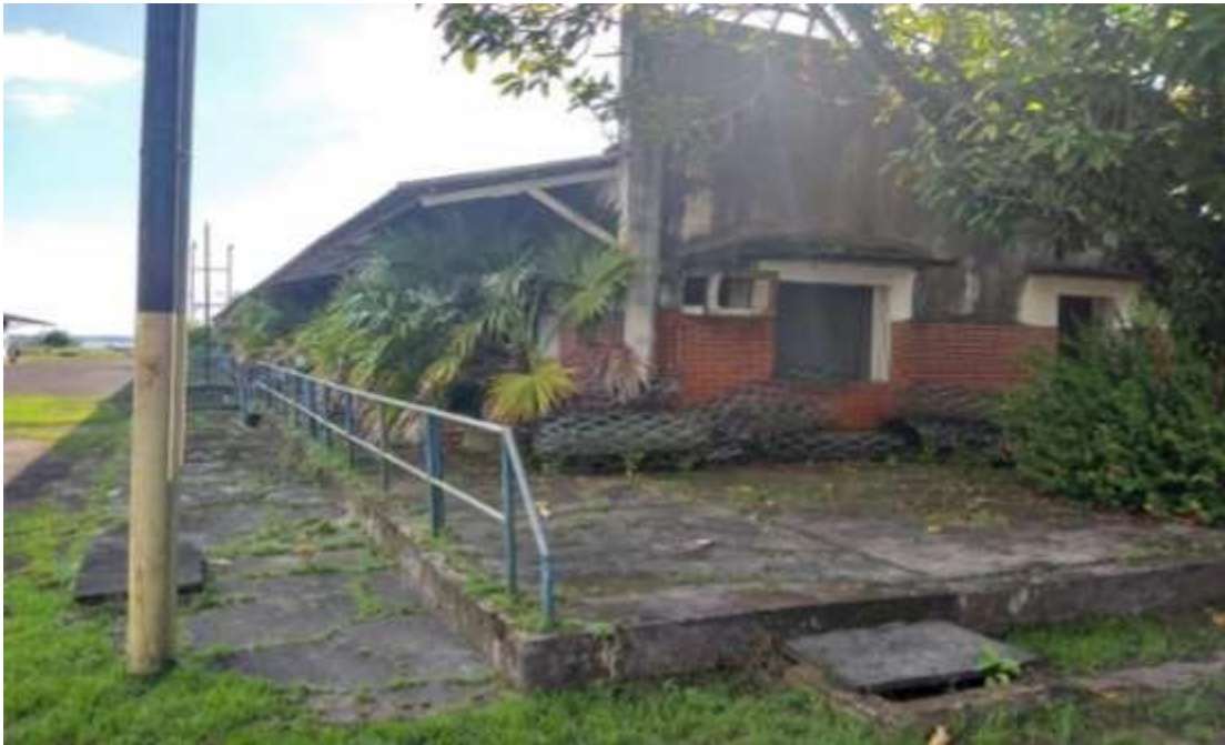
Figura 6 - Galpão em péssimo estado de conservação.